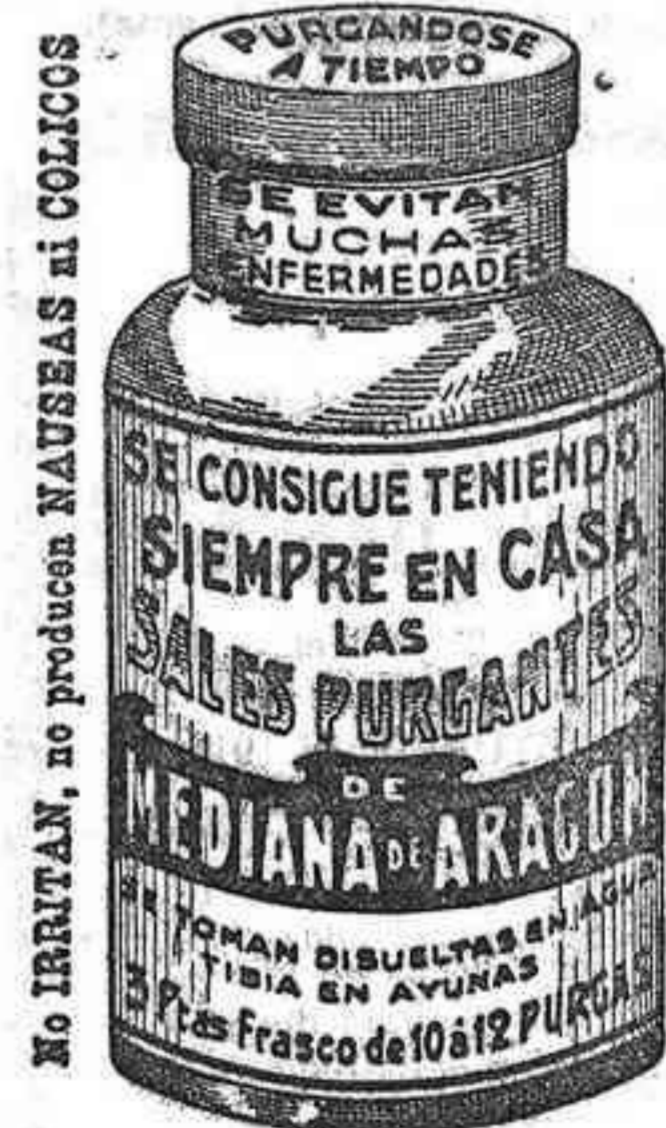
No irritan, no producen NAUSEAS ni COLICOS

Damos y exigimos toda clase de referencias. Escribid á PRODUCTOS ORO, Apartado 716. BARCELONA.