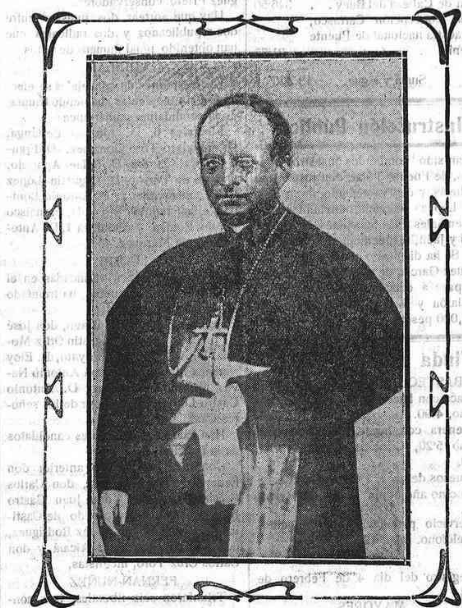
El nuevo Pontífice: Su Santidad Pío XI

Quién tiene el alma presa por la cadena de las conveniencias sociales no está en el desierto; quien lleva sujeto el corazón por los apetitos terrenales vive en compañía absorbente que le esclaviza; quien se somete a las preocupaciones sociales; enemigas de Dios, no conoce el desierto y no escucha, no llegan a él las palabras que le conducen al cielo como orienta al caminante el sonido de la campana en noche desahucible y oscura.