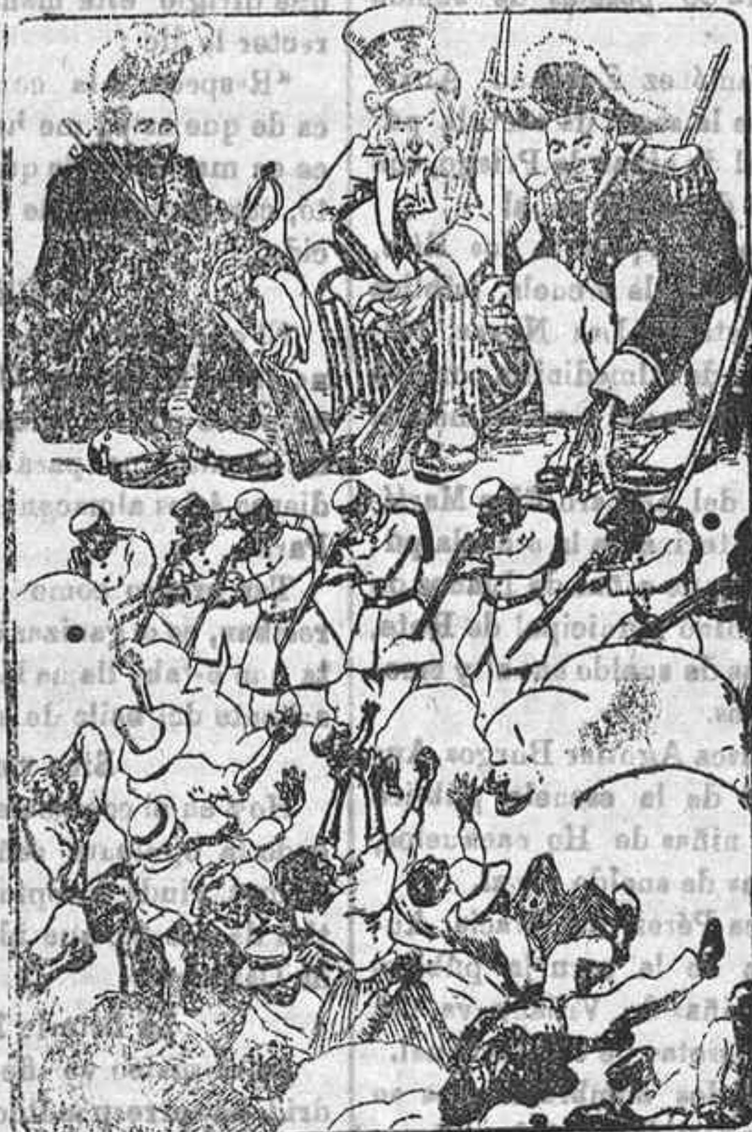
UNA NUEVA APLICACIÓN DE LA DOCTRINA DE MONROE (De «Ho. n. Selectas» revista para todos)

afeción nacida en virginal campo, en días de dicha sin igual, del incomparable felicidad. Muy joven era: una niña. Pero una niña, no como las demás: era un ser celestial, un ángel sobre la tierra, que el Supremo ser había colocado, y él inspiró la afeción.