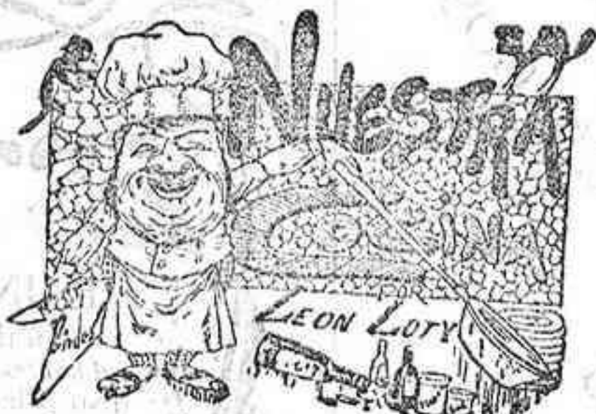
Comidas para el 23 de Junio

El Hermano Mayor de tan Ilustre Cofradía, ruega á todos los cofrades de la misma, asistan puntualmente á tan brillantes cultos, con la medalla que usan en las principales fiestas.