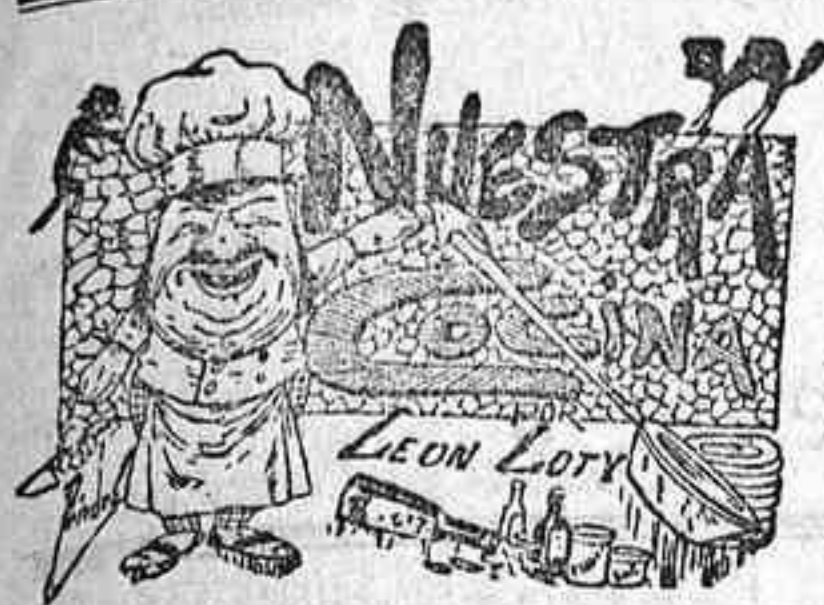
Comidas para el 13 de Junio

Sus hijos ruegan á sus parientes y amigos lo encomienden á Dios Nuestro Señor en sus oraciones.