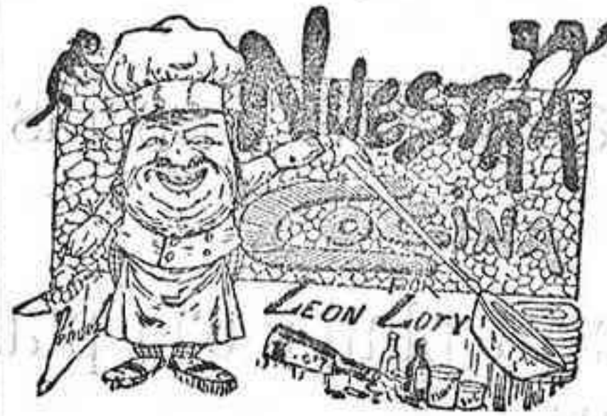
Comidas para el 4 de Febrero