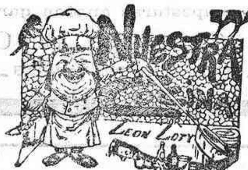
Comidas para el 17 de Octubre

En la iglesia de San Pedro Alcántara se hace el ejercicio del mes del Rosario al toque de oraciones.