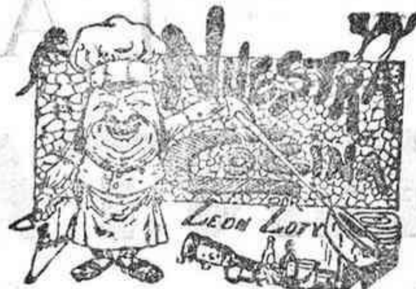
Comidas para el 5 de Octubre

Acceite, de 46 1/2 a 47 1/2 reales arroba.—Trigo duro y blanquillo, de 40 a 41 reales fanega.—Cebada, de 24 a 25.—Habas de aguadulz, de 46 a 48.—Idem morunas, de 43 a 44.—Idem castellanas y cochineras, de 42 a 44.—Garbanzos, de 50 en adelante.—Alverjones, de 40 a 41.—Escalaña, de 19 a 20.—Harina blanca extra, a 17 1/2 reales arroba.—Idem idem corriente, a 16 3/4.—Idem idem recia superior a 15 1/2.—Idem idem corriente, a 14 3/4.—Idem idem 3.ª, a 12 1/2.