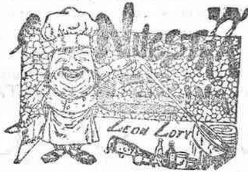
Comidas para el 19 de Septiembre