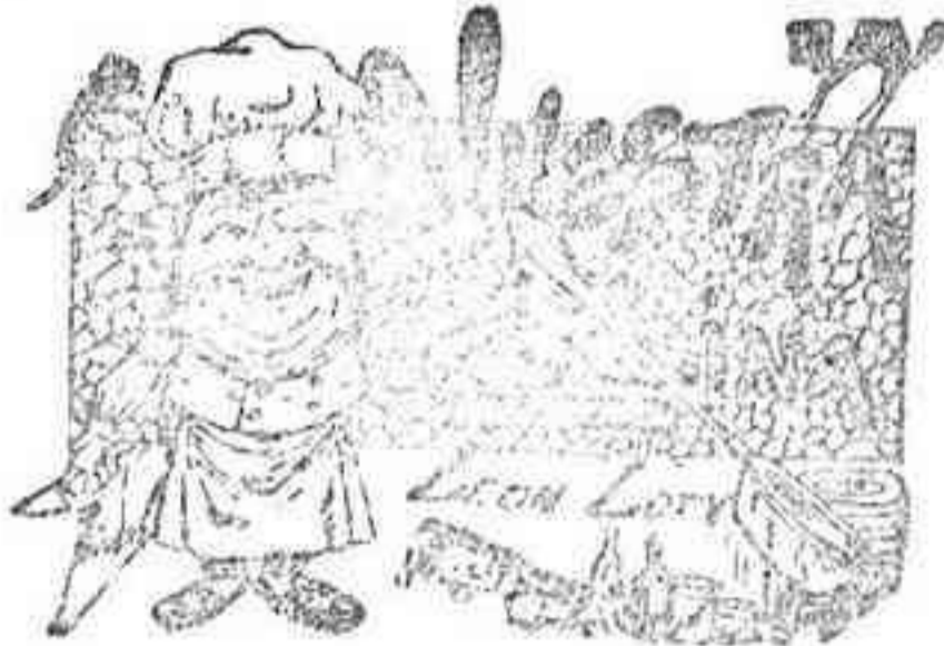
Comidas para el 6 de Septiembre

ALMUERZO.—Calamares fritos.—Mendugillos de gallina con salsa Robert.—Cabrillo asado.—Ensalada de patatas.—Postres.