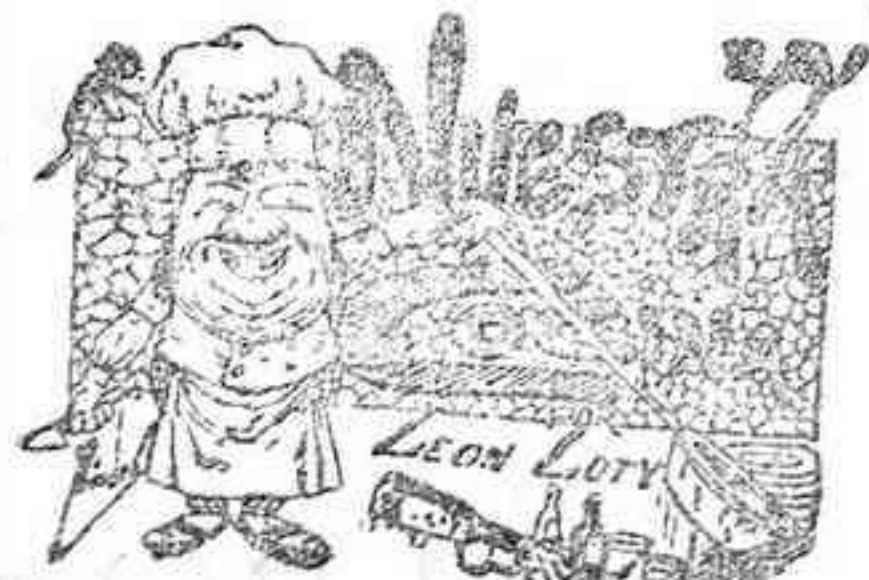
Comidas para el 27 de Julio

Liturgia.—Día 27.—Sábado.—La Misa y oficio son de S. Aurelio y compañeros mártires de Córdoba, con rito doble y color encarnado. Se hace conmemoración de la octava en Laudes y Misa, esta es Salus con evangelio del oficio, Credo y Prefacio de la octava. En las segundas vísperas se hace conmemoración de S. Nazario y compañeros mártires y de la octava.