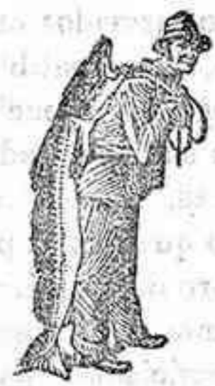
¡Obténase siempre la Emulsión con esta marca "El Pescador" marca del proclivimiento Scott!

LEDESMA (Salamanca), Calle de los Curas, 2 de Marzo de 1907.