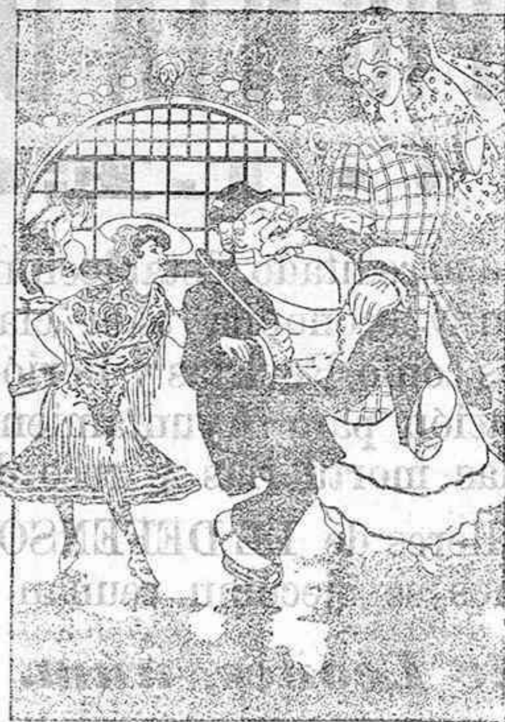
L' ENTENTE CORDIALE