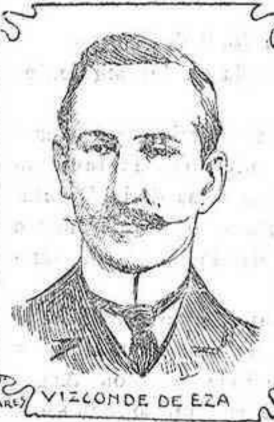
VIZCONDE DE EZA