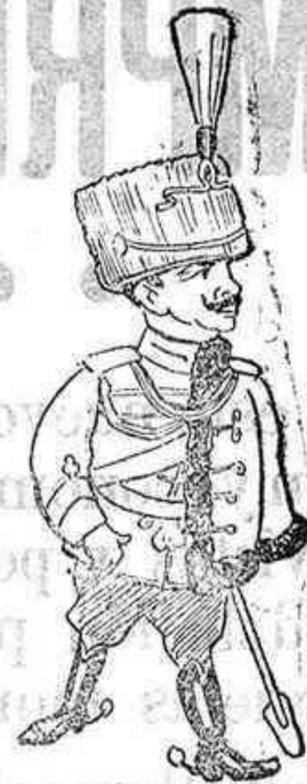
LA DEL REY DE ITALIA

los timadores las consabidas pesetas, las cuales recuperó, teniendo necesidad para ello de acudir a razonamientos contundentes.