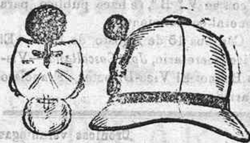
El nuevo casco y granada

El cuello, hasta hoy recto, de la levita, será, en adelante, vuelto, con el número y ganada de metal en cada una de sus puntas.