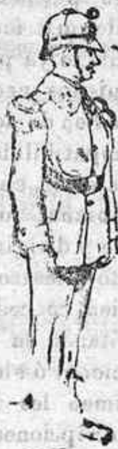
Soldado de infanteria

En primer lugar el bombacho ha sido substituido por el pantalón largo, en la forma que lo representa el presente dibujo.