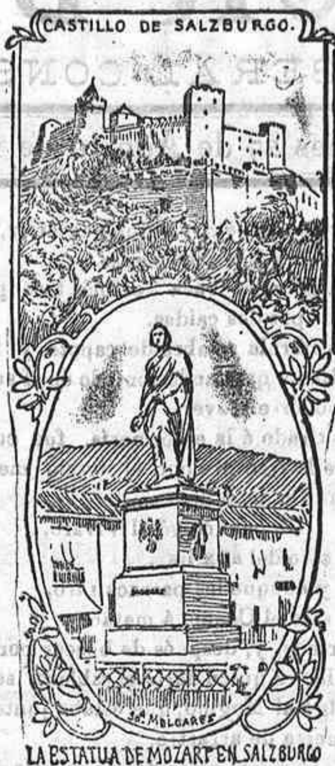
LA ESTATUA DE MOZART EN SALZBURGO

en sus óperas como en las obras sinfónicas, escogidas entre lo más selecto de su repertorio.