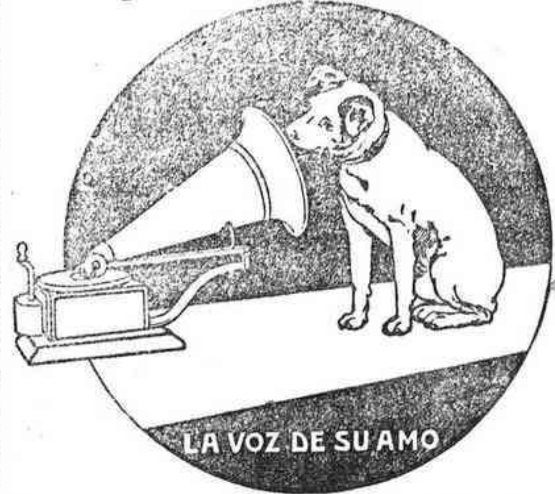
LA VOZ DE SU AMO

Representante de la casa Piazza de Sevilla