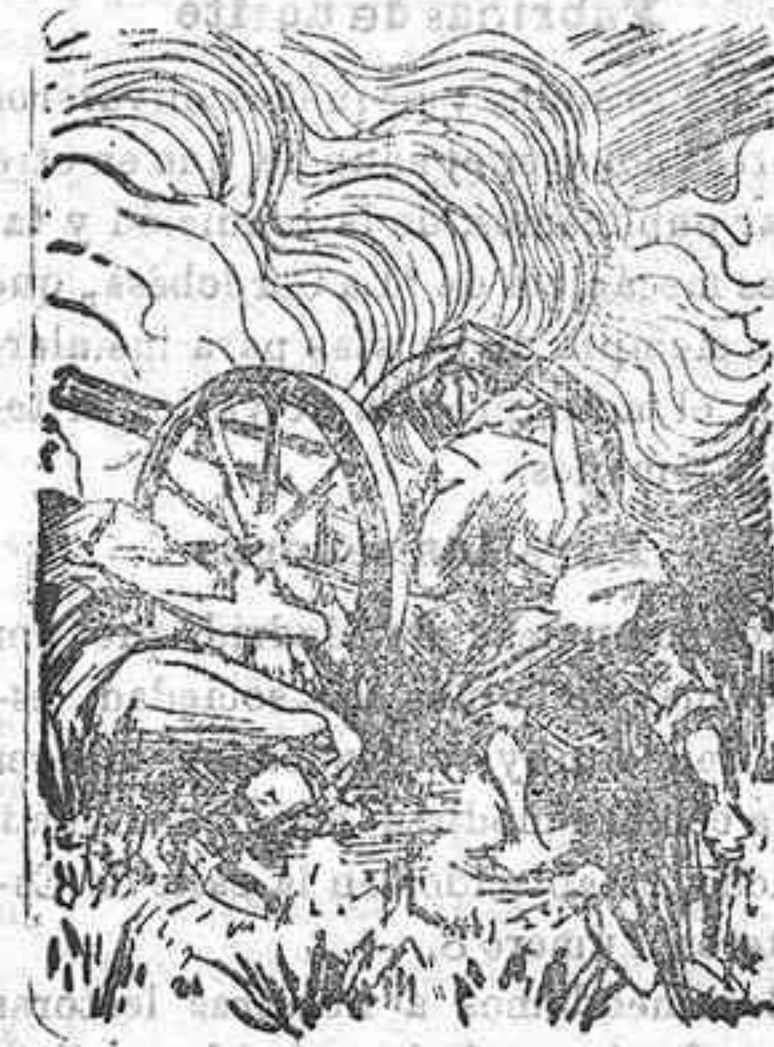
Artilleros japoneses colocando una batería en Port-Arthur.