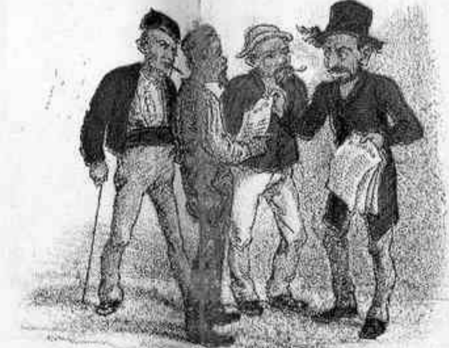
SE ENTREGA A LA PREDICACION DE CIERTAS DOCTRINAS.