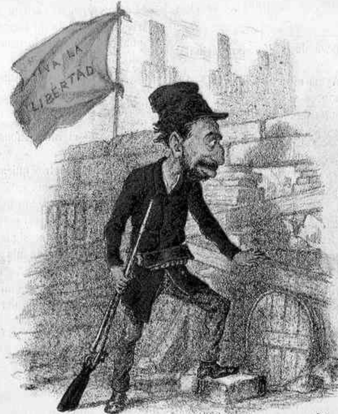
(¿DE VERAS ESTUVO EN LAS BARRICADAS?)