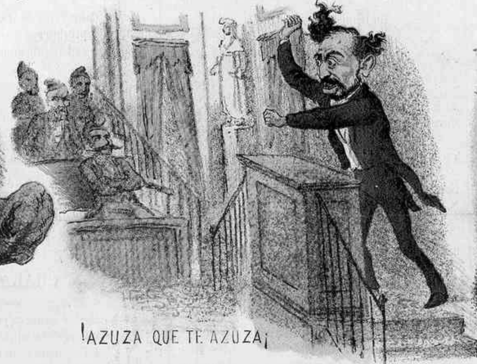
¡AZUZA QUE TE AZUZA!