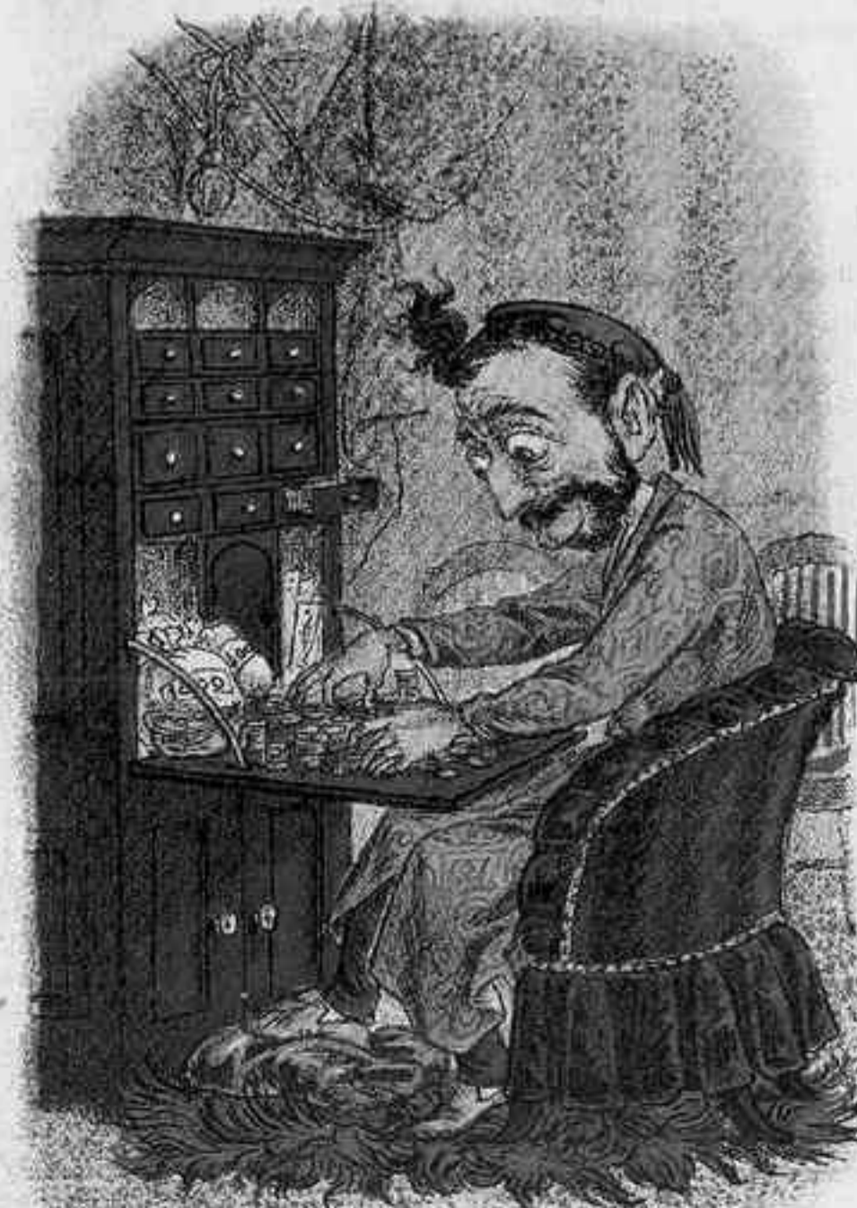
TRANSFIERE (SEAMOS CULTOS)