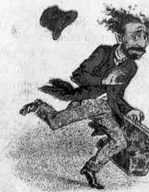
DE VERAS HUYE