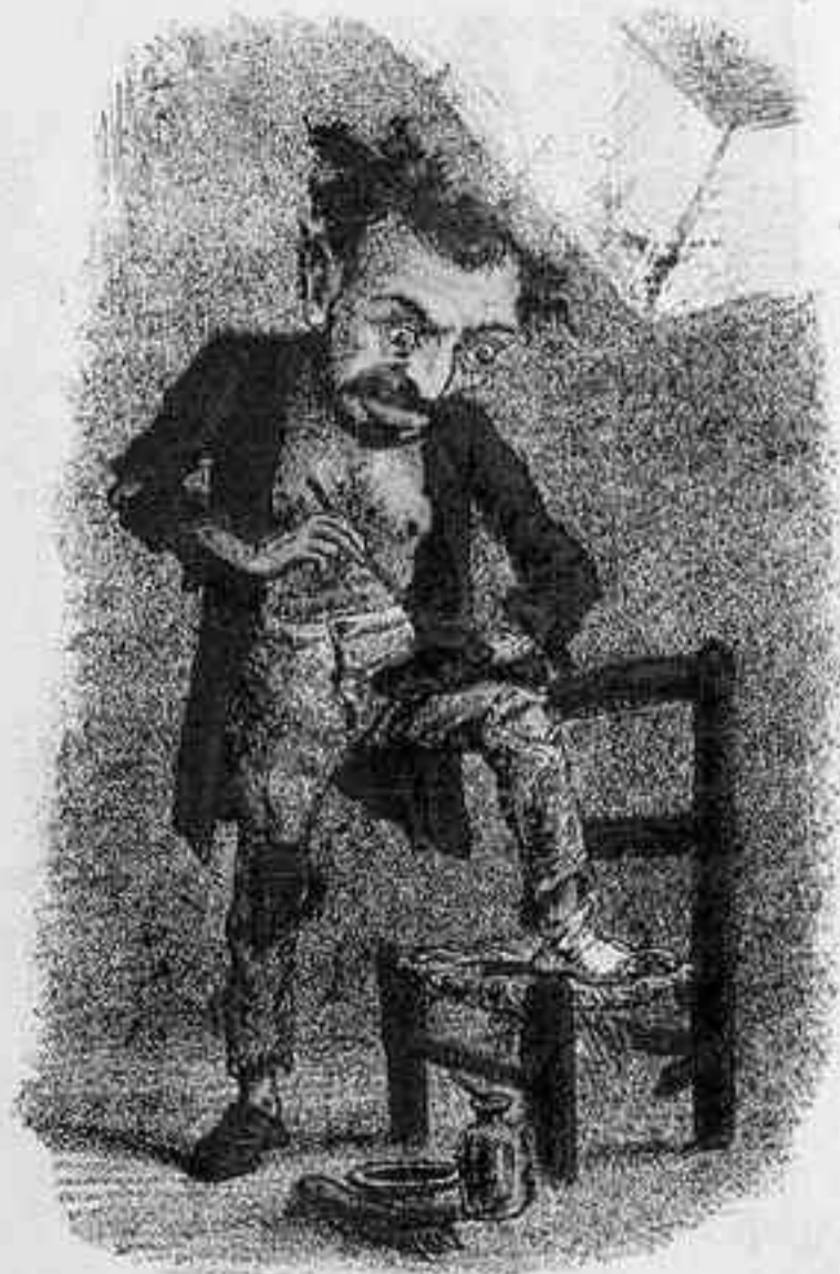
EN LA EMIGRACION