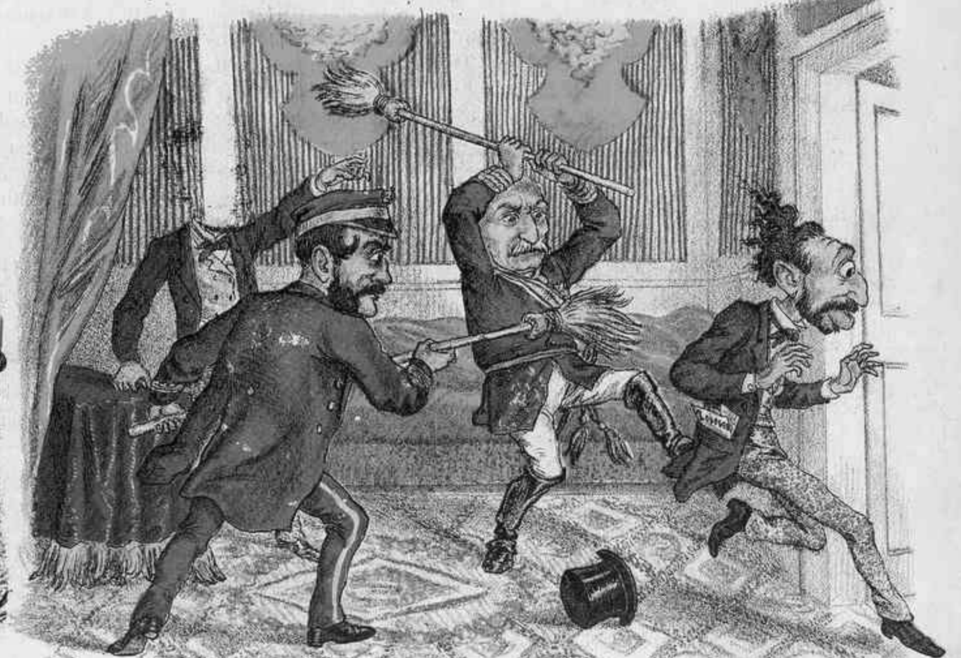
CAPITULO DEL PORVENIR.