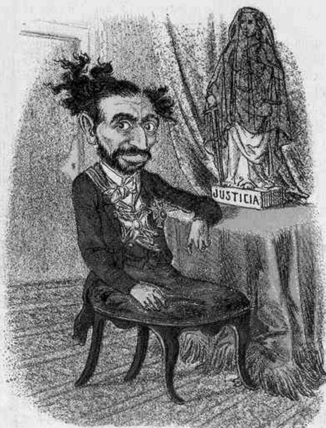
¡YA ES PRESIDENTE, CANARIO! ¿CUANDO SERÁ.....?