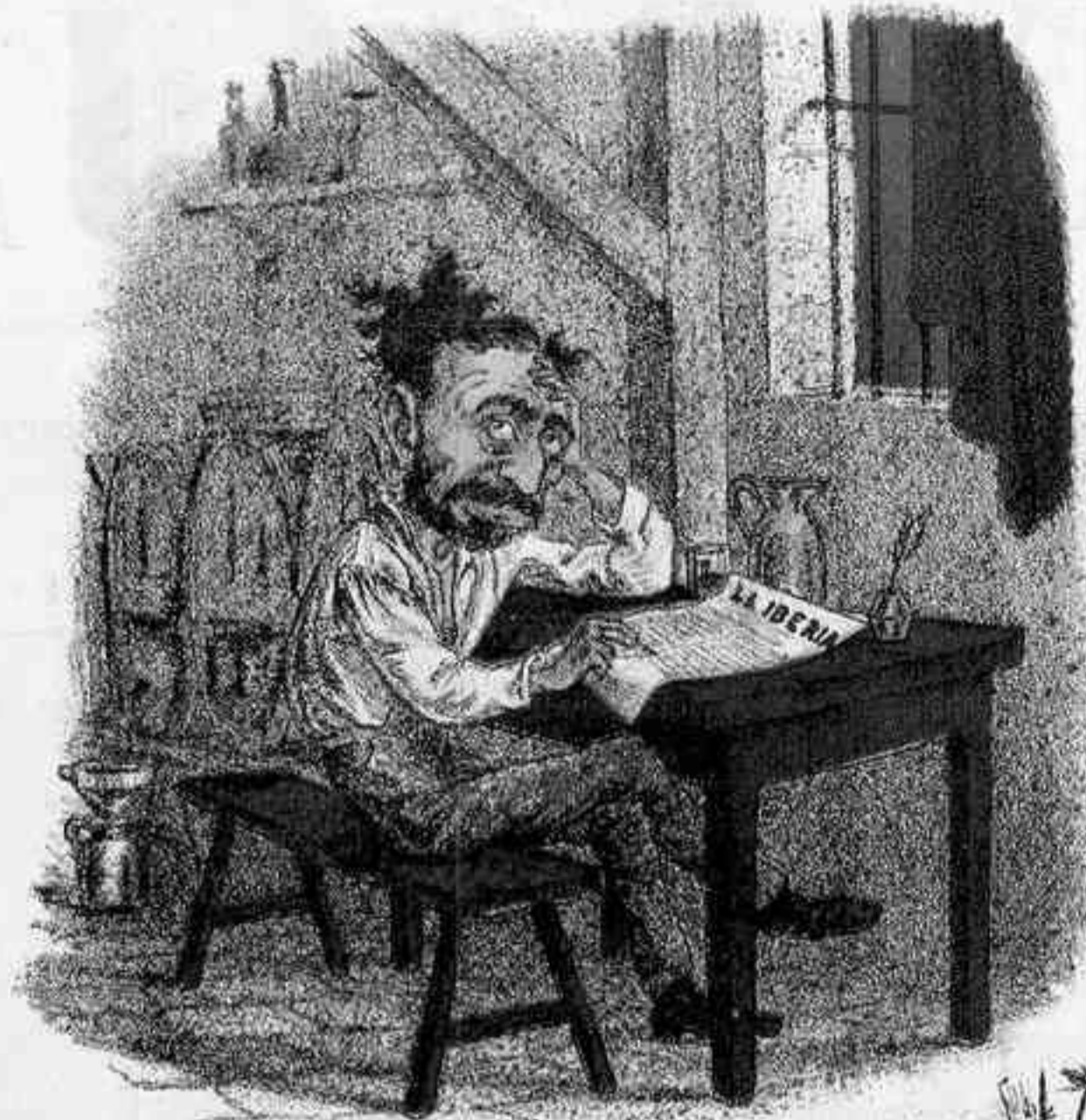
EN LA REDACCION SECRETA.