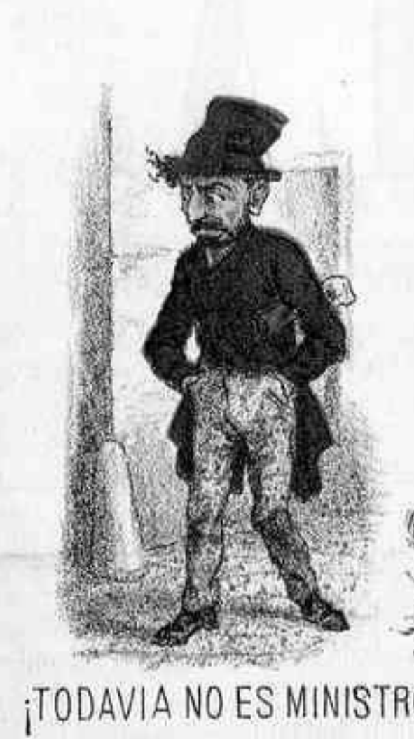
¡TODAVIA NO ES MINISTRO!