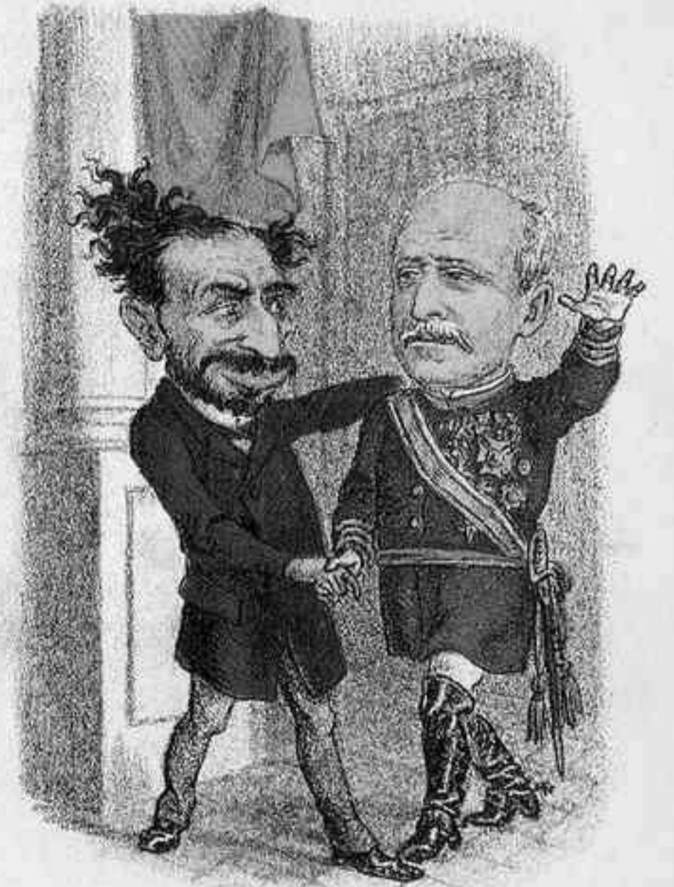
VA CON MALAS COM.....