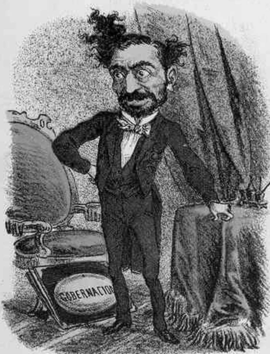
¡EH! YA ES MINISTRO EL DEL TUPÉ.