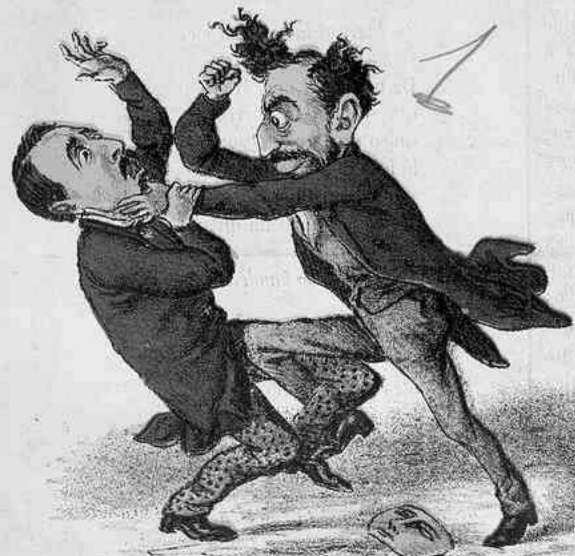
USA CONTRA RUIZ ZORRILLA DE PUÑADA Y ZANCADILLA.