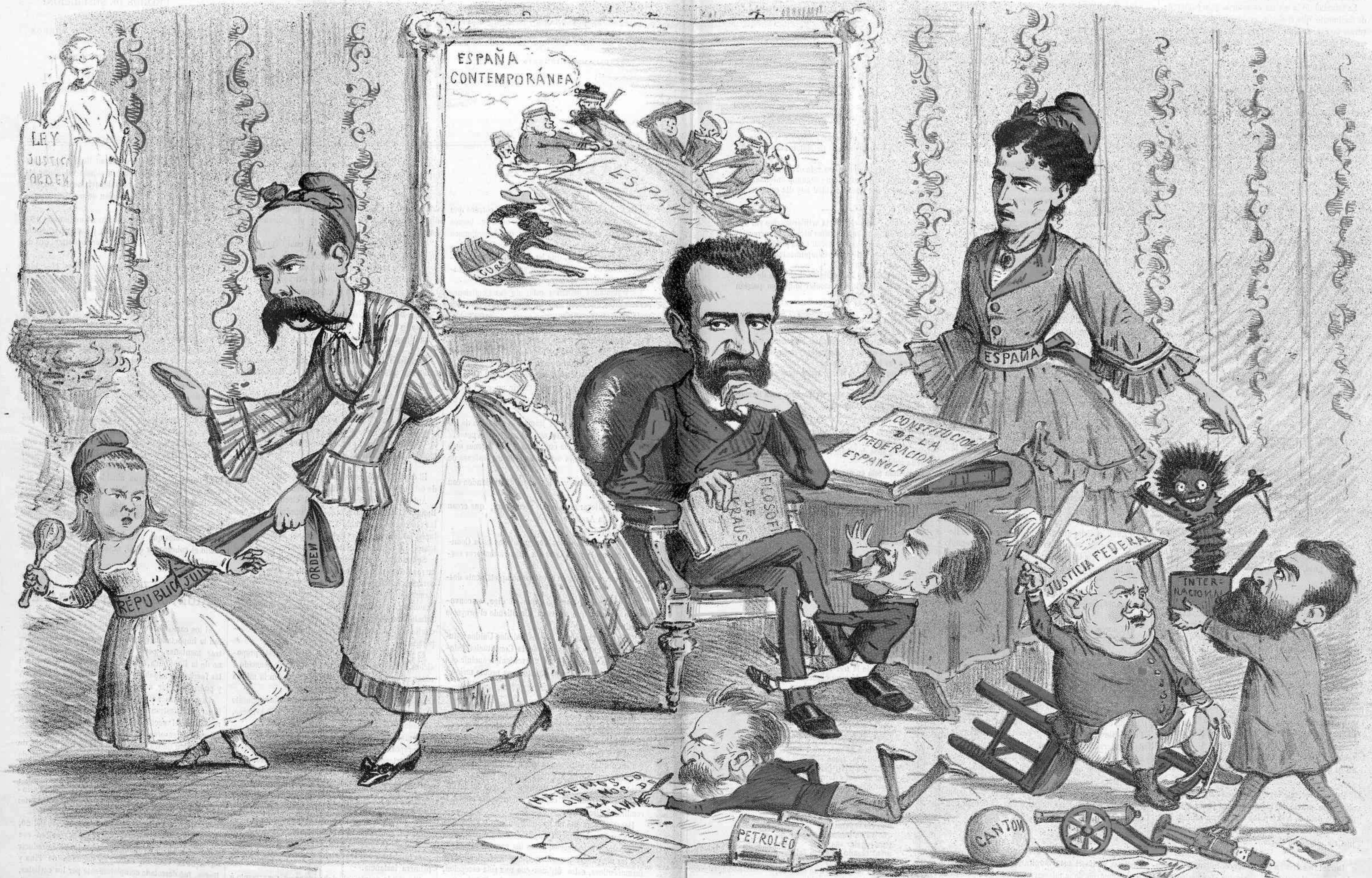
Si no castigas à estos rapazuelos nos van à perder la niña.