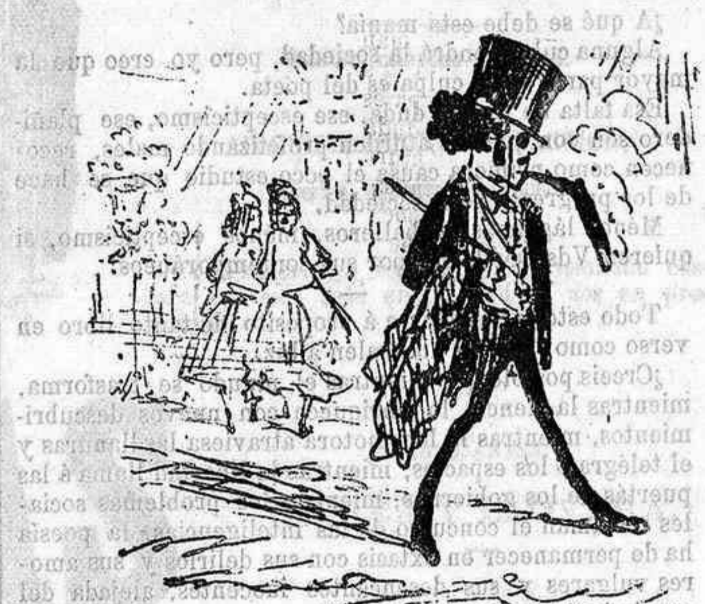
El primer vuelo.