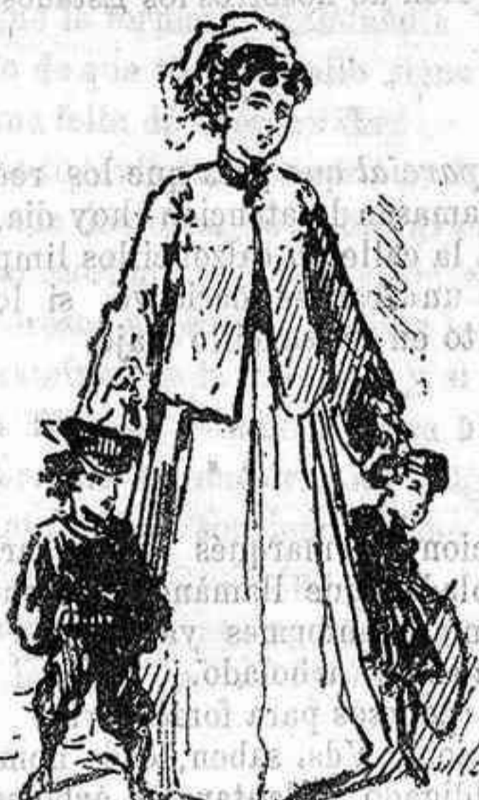
Horuga (nos pasea).