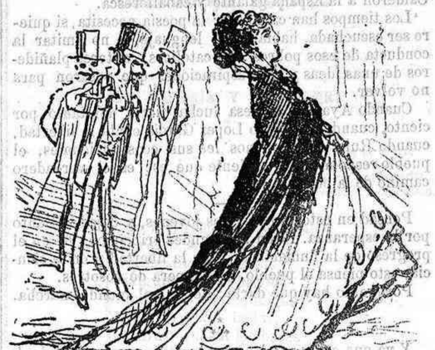
Mariposa (nos despluma).