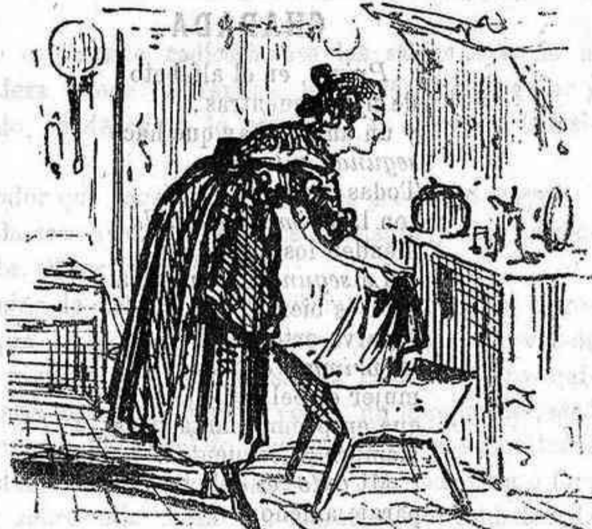
Larva (nos limpia).