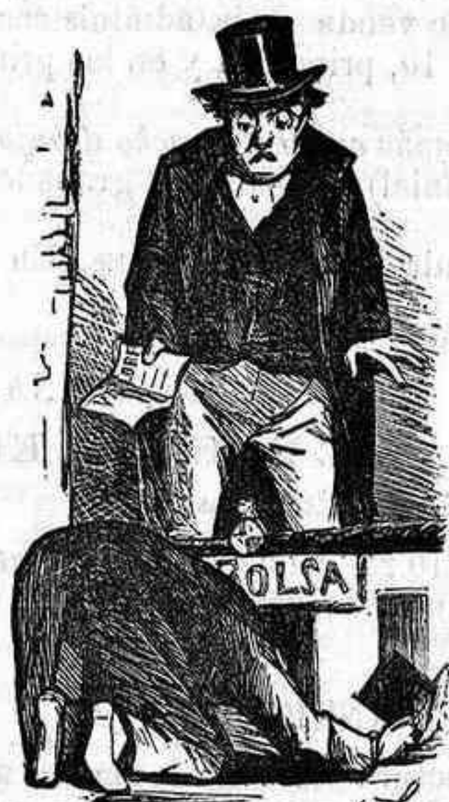
Aria de baja

Un caballero particular á quien no le importa un pito de nada, y que por lo tanto está llamado á hacer gran papel en la política española.