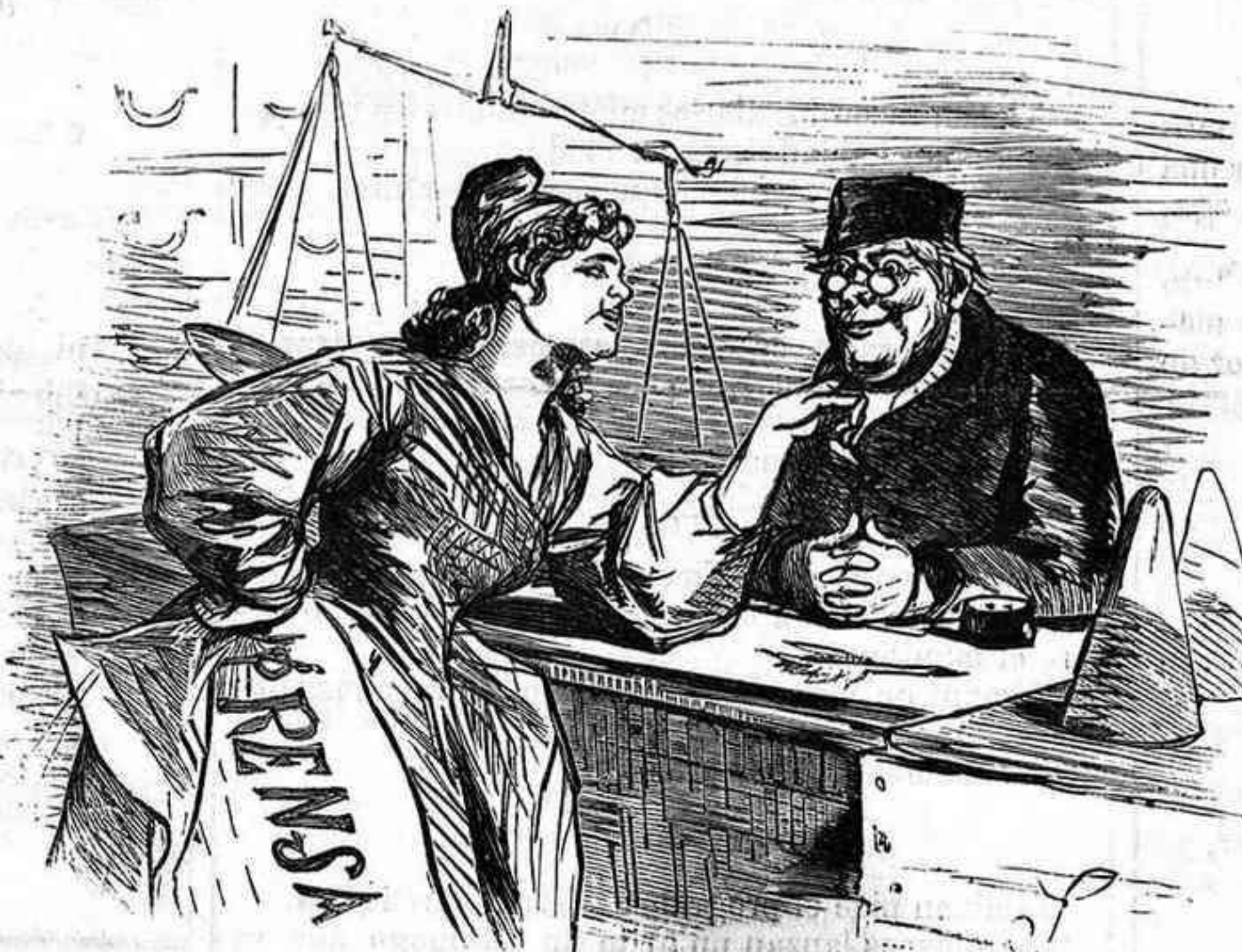
Viaje alrededor de un editor.

La caricatura que ocupaba este hueco ha sido prohibida por el señor gobernador.