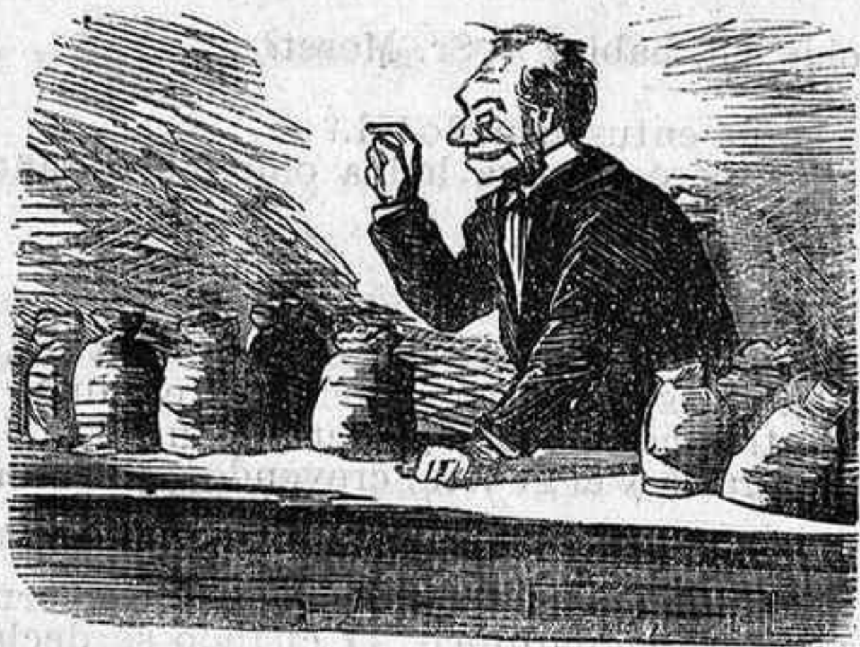
Apuros de un «pobre» capitalista español.

—No queriéndome interesar en los empréstitos, ni desarrollar una industria, ¿qué va á ser de mí con tanto dinero? ¡Ah, qué país!