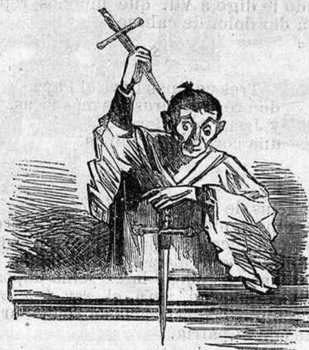
La nueva predicación.

El Gran Turco se viste á la europea para venir á España á saber por qué aquí no se tolera á los musulmanes cuando él tolera á los cristianos.