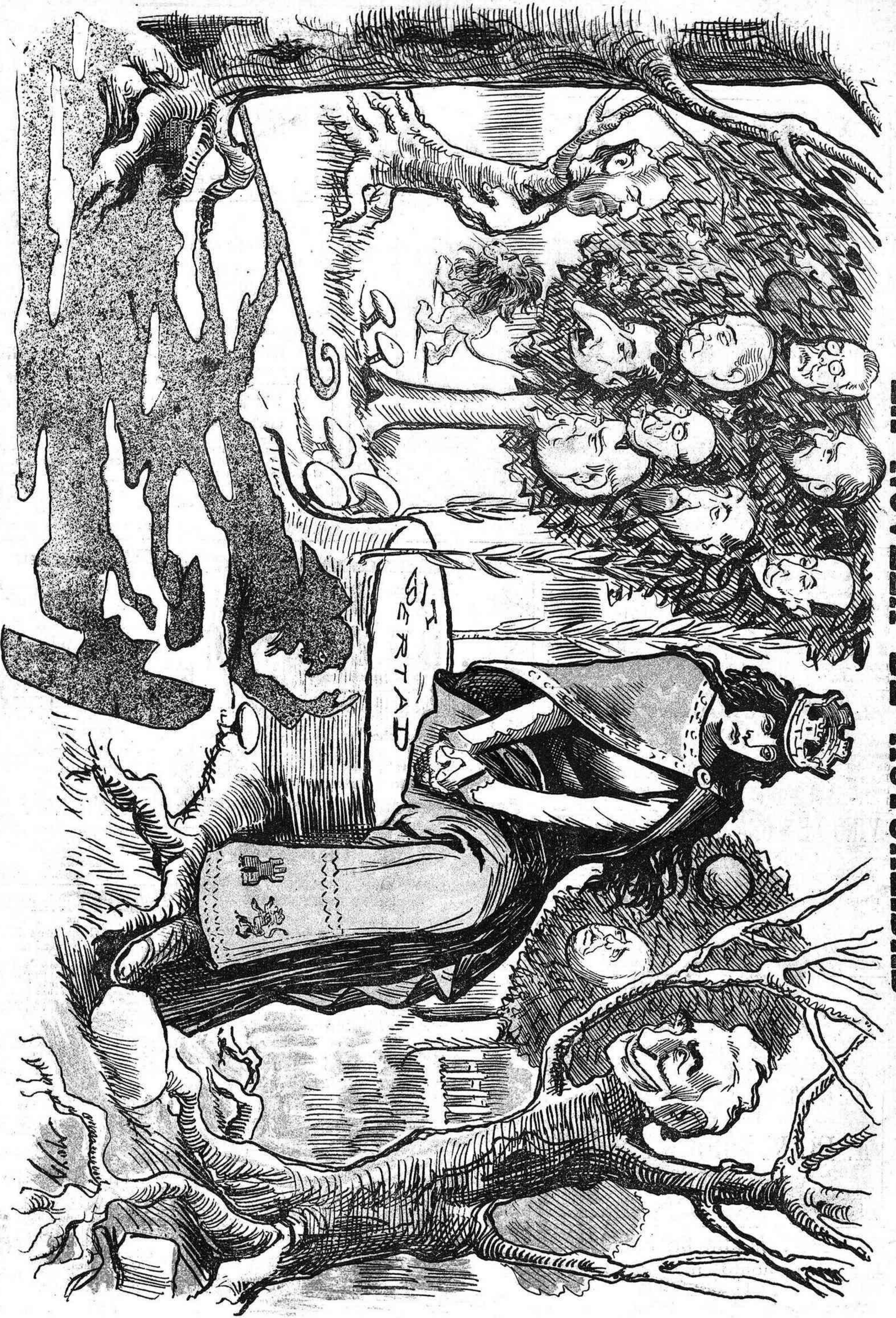
Entre narajos... y entre manzanillos.