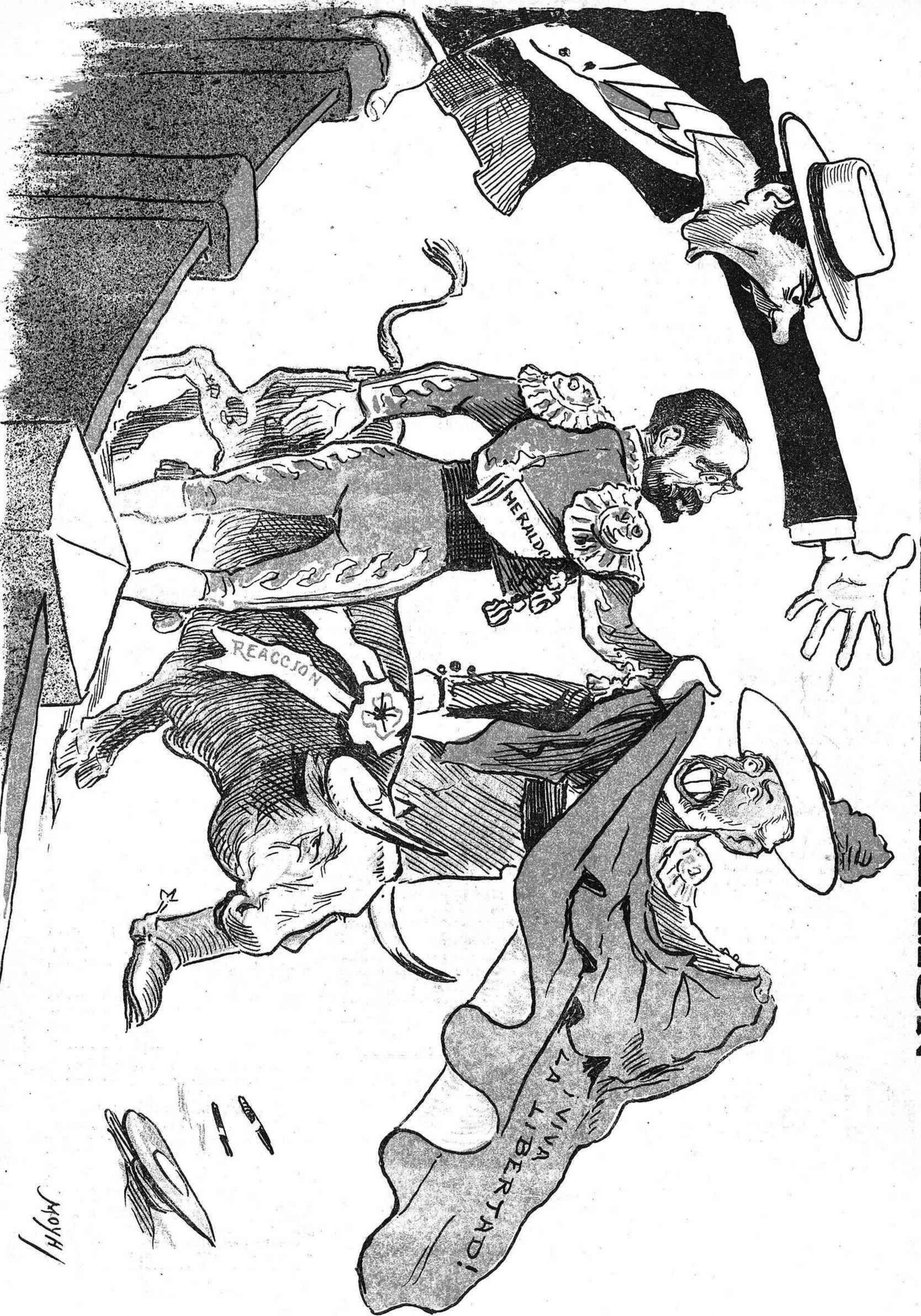
Uno de la barrera.—Bien torreado; pero lo que hace falta es matar á ese bicho.