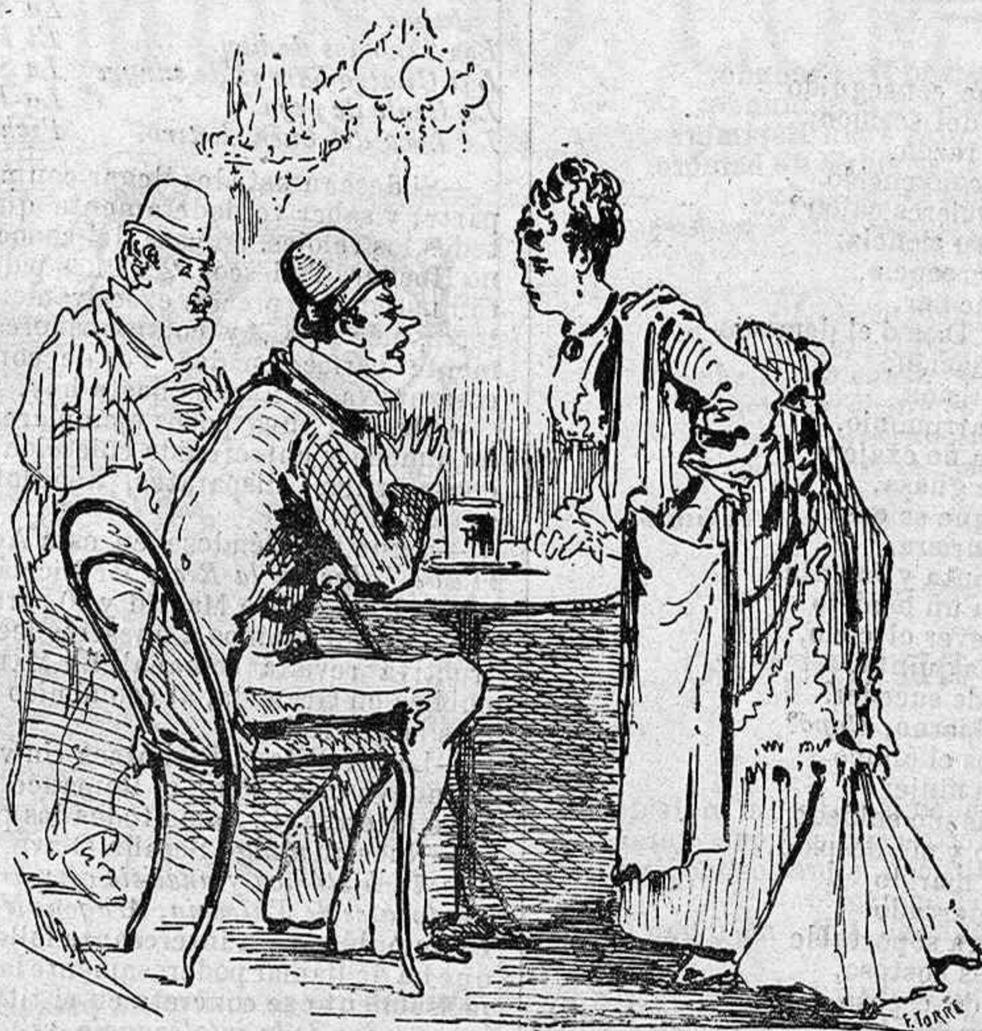
Quien piensa refrescar zumo de chufas—sufré una decepcion como otras muchas; —pues halla el infeliz que tal quisiera,—en el vaso, horchata, petróleo en la horchatera.

Esto es bueno, lector, que lo recuerdes, á fin que no cometas tal diablura, y pierdas por coger las uvas verdes la forma, la belleza y la hermosura.