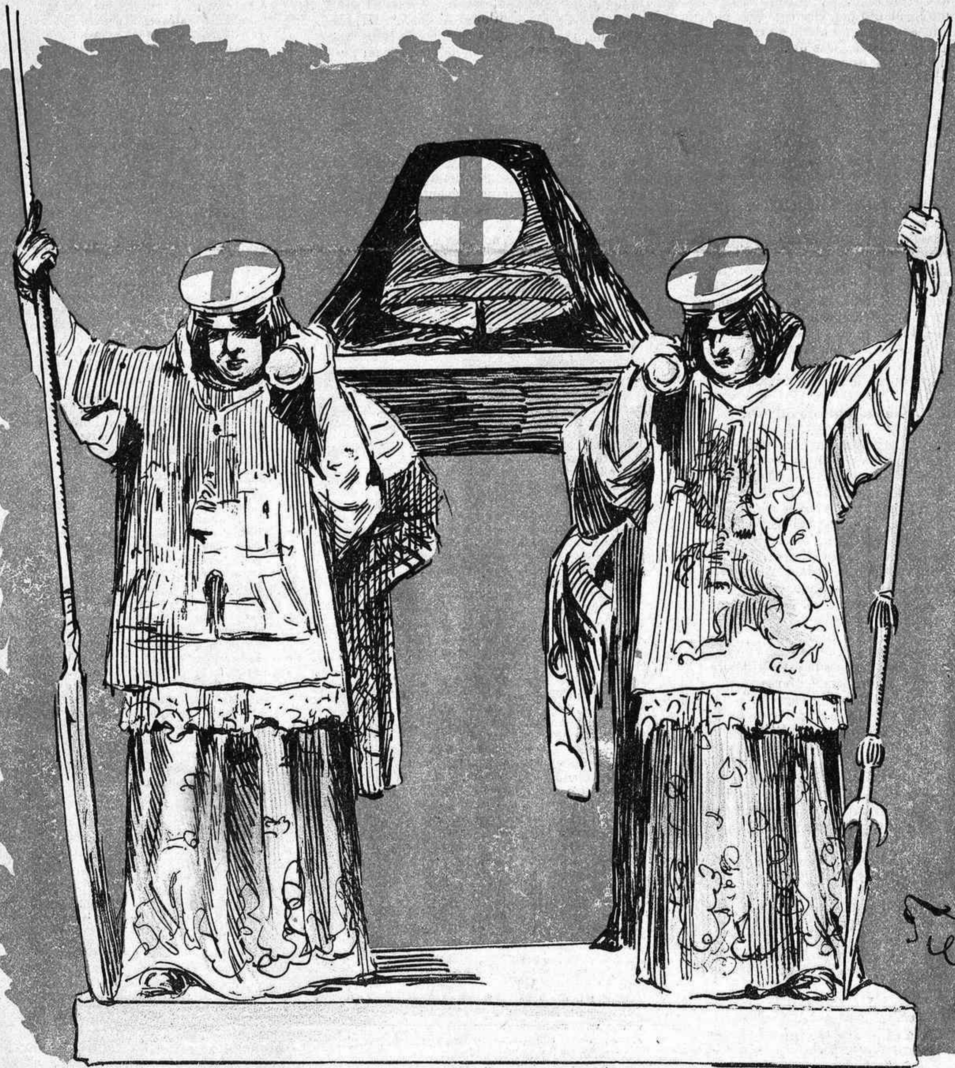
EL ÚLTIMO REPATRIADO