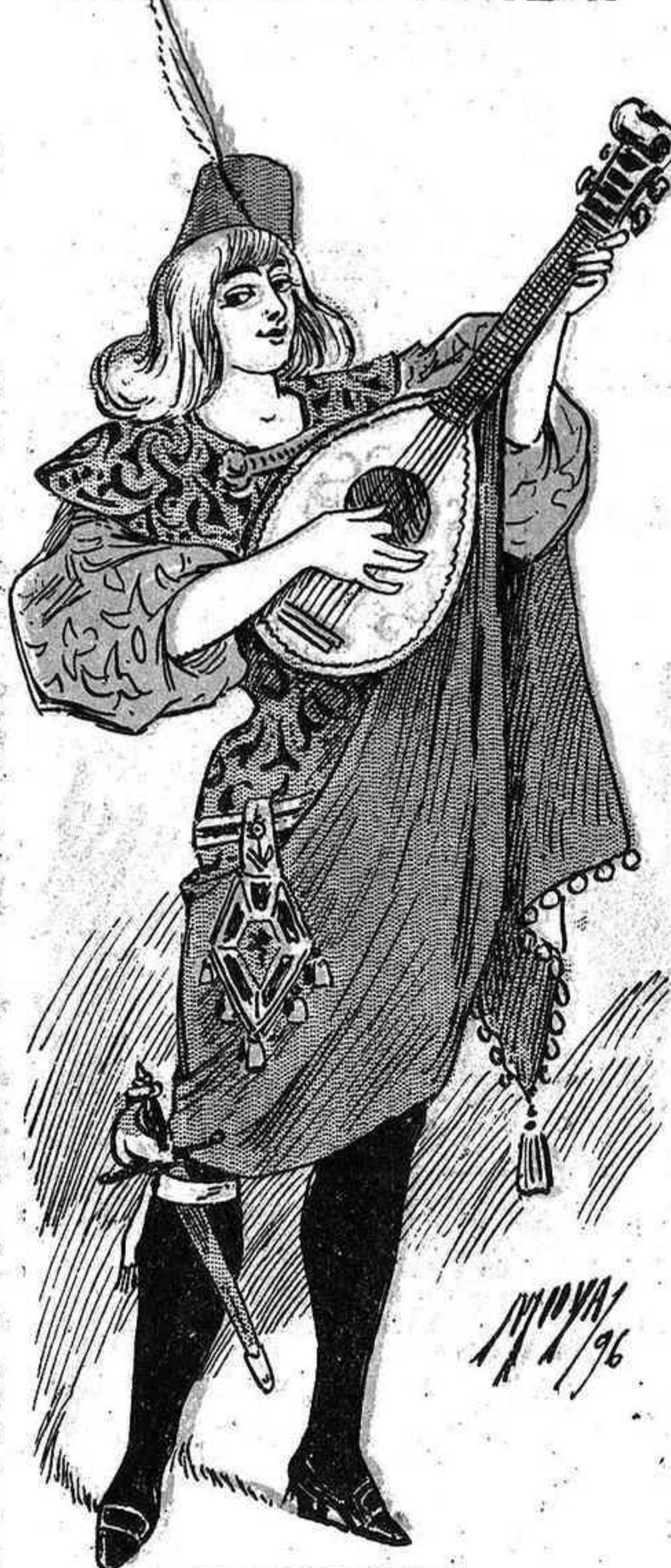
LA FLORENTINA, corista de Apolo