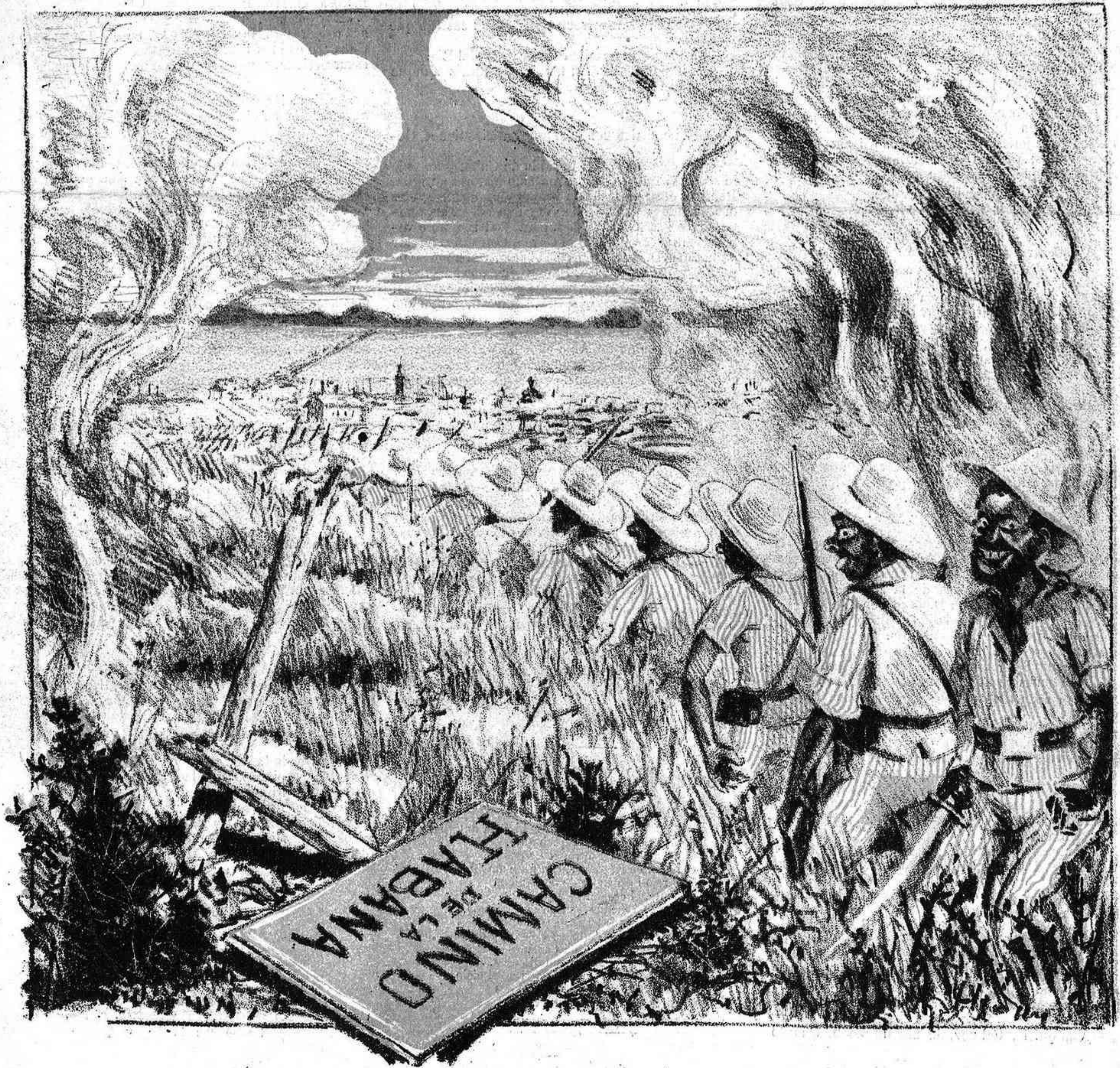
Gente rezagada que va á la manifestación