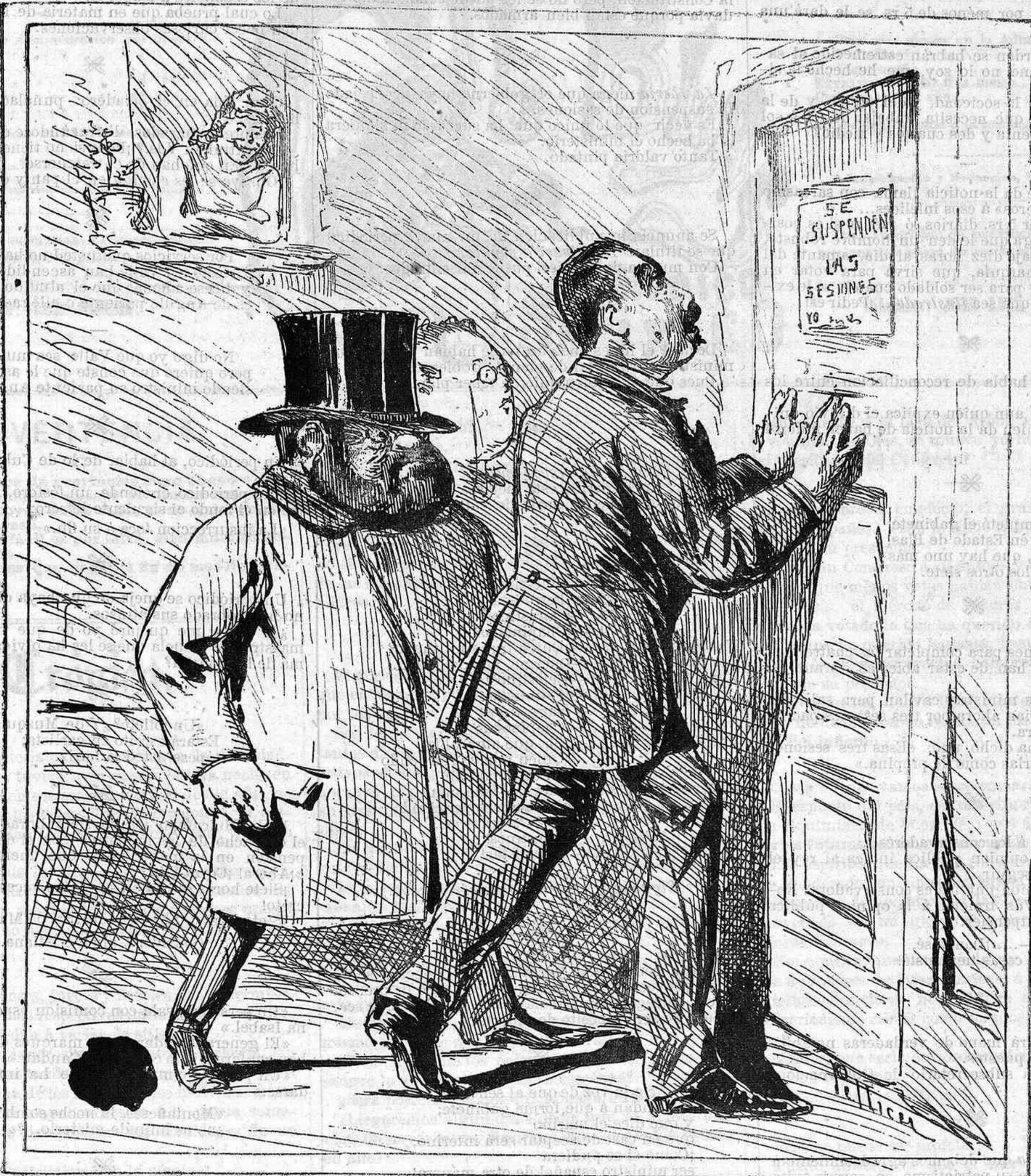
QUIEN DA PAN Á PERRO AJENO.....

—En el tiempo que queda. Como los sastres se hacen gorras con las recortaduras de los trajes de los parroquianos.