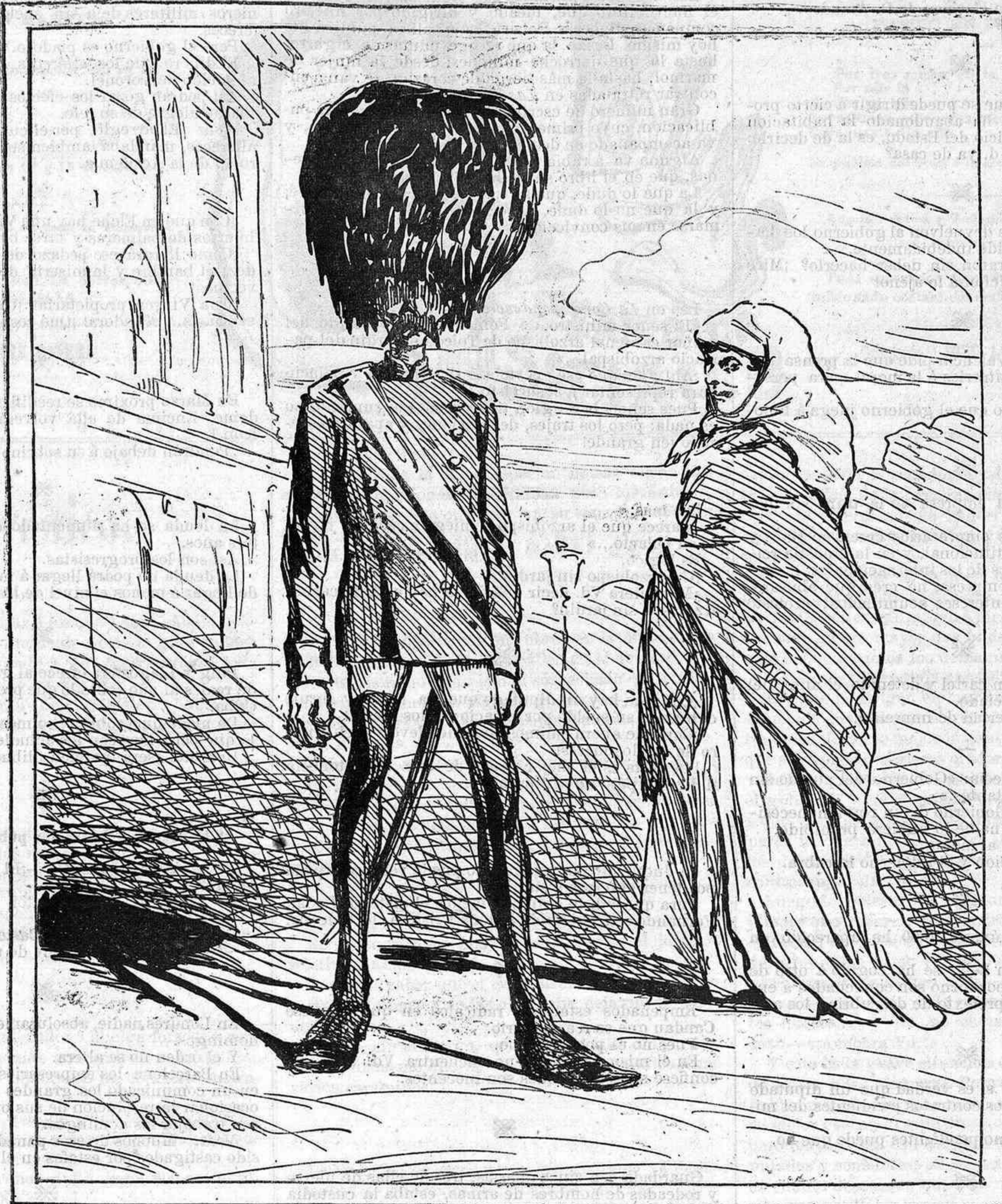
—Señor Guardia Real, diga Vd. á su amo que no gaste tanto en pelo.

Desiguales desde una escena á otra, no hay uno solo de estos personajes que proceda siempre como—dado su carácter—debería proceder.