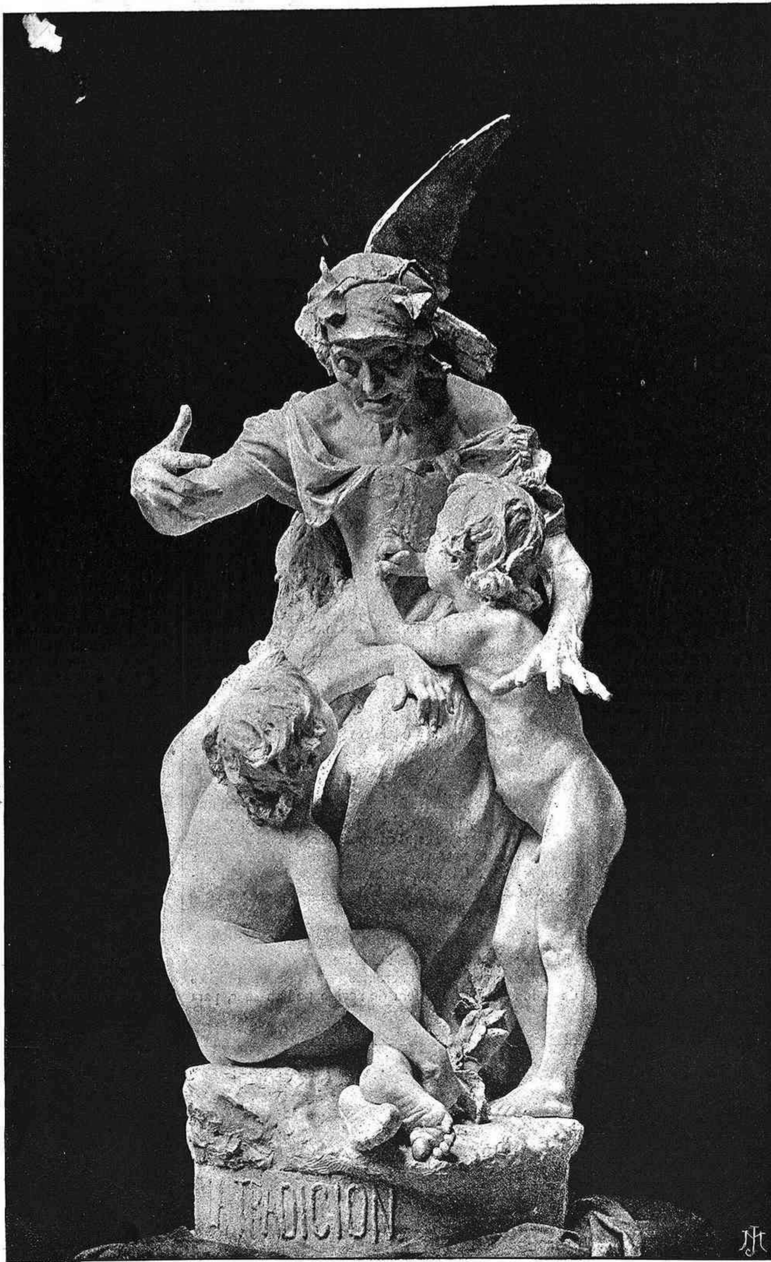
LA TRADICIÓN, escultura de Agustín Querol (Medalla de primera clase)

Quedan reservados los derechos de propiedad artística y literaria IMP. DE MONTANER Y SIMÓN