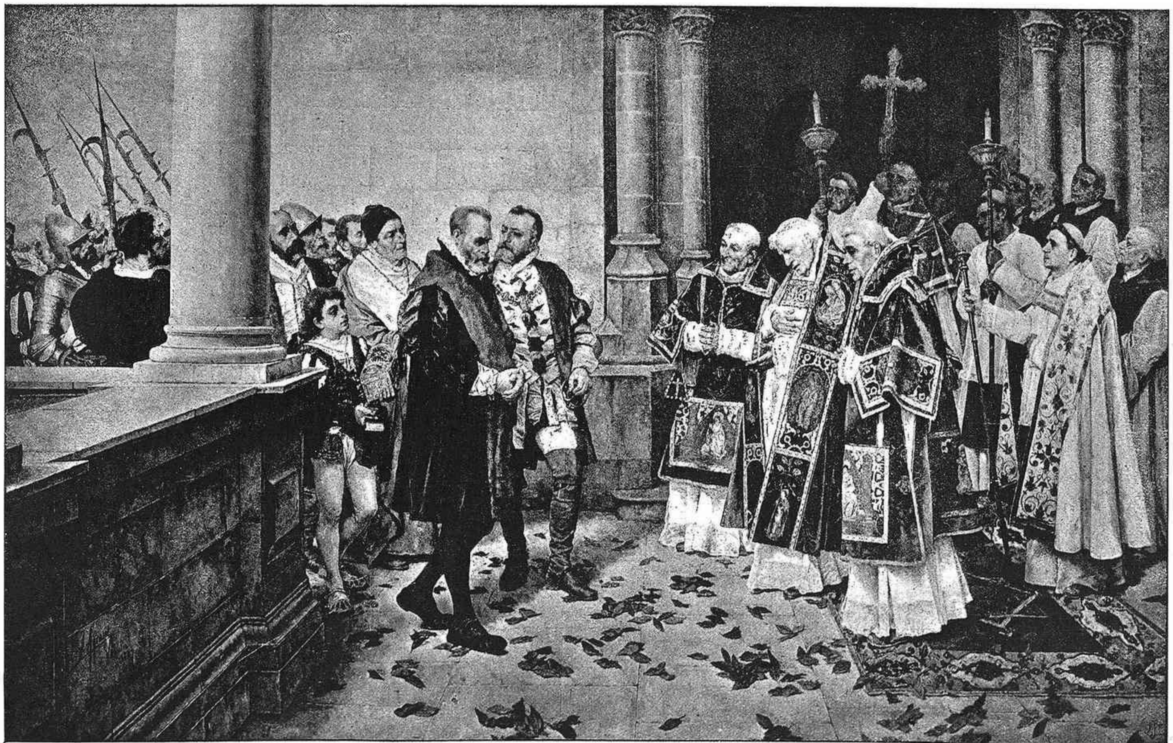
ENTRADA DEL EMPERADOR CARLOS V EN EL MONASTERIO DE YUSTE, cuadro de J. Agrasot

La cantidad de la materia cósmica es inmensa. En primer lugar lo indica la existencia de la luz zodiacal, que durante centenares de años se verá en el cielo occidental por marzo y abril, y en el cielo oriental por setiembre y octubre; explicada por Casini I como reflejo de la luz solar desde innumerables cuerpos diminutos que giran al rededor del sol; por Herschell como las más densas partes del medio resistente que retarda la marcha de los cometas, cargado acaso con residuos robados á las colas de millones de estos cuerpos al pasar por su pe rihe