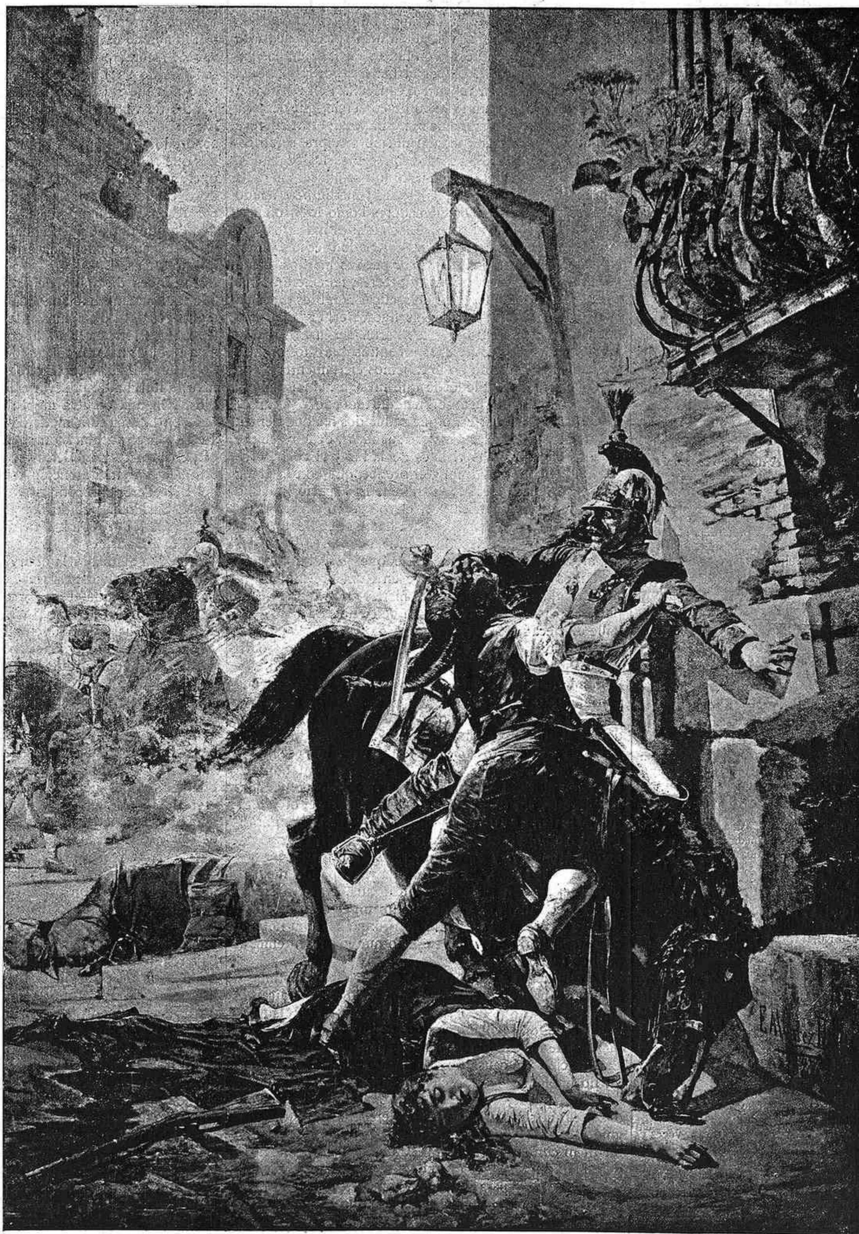
MALASAÑA Y SU HIJA SE BATEN CONTRA LOS FRANCESES EN 1808 CUADRO DE E. ALVAREZ DUMONT. — MEDALLA DE TERCERA CLASE.

EXPOSICIÓN NACIONAL DE BELLAS ARTES DE 1887