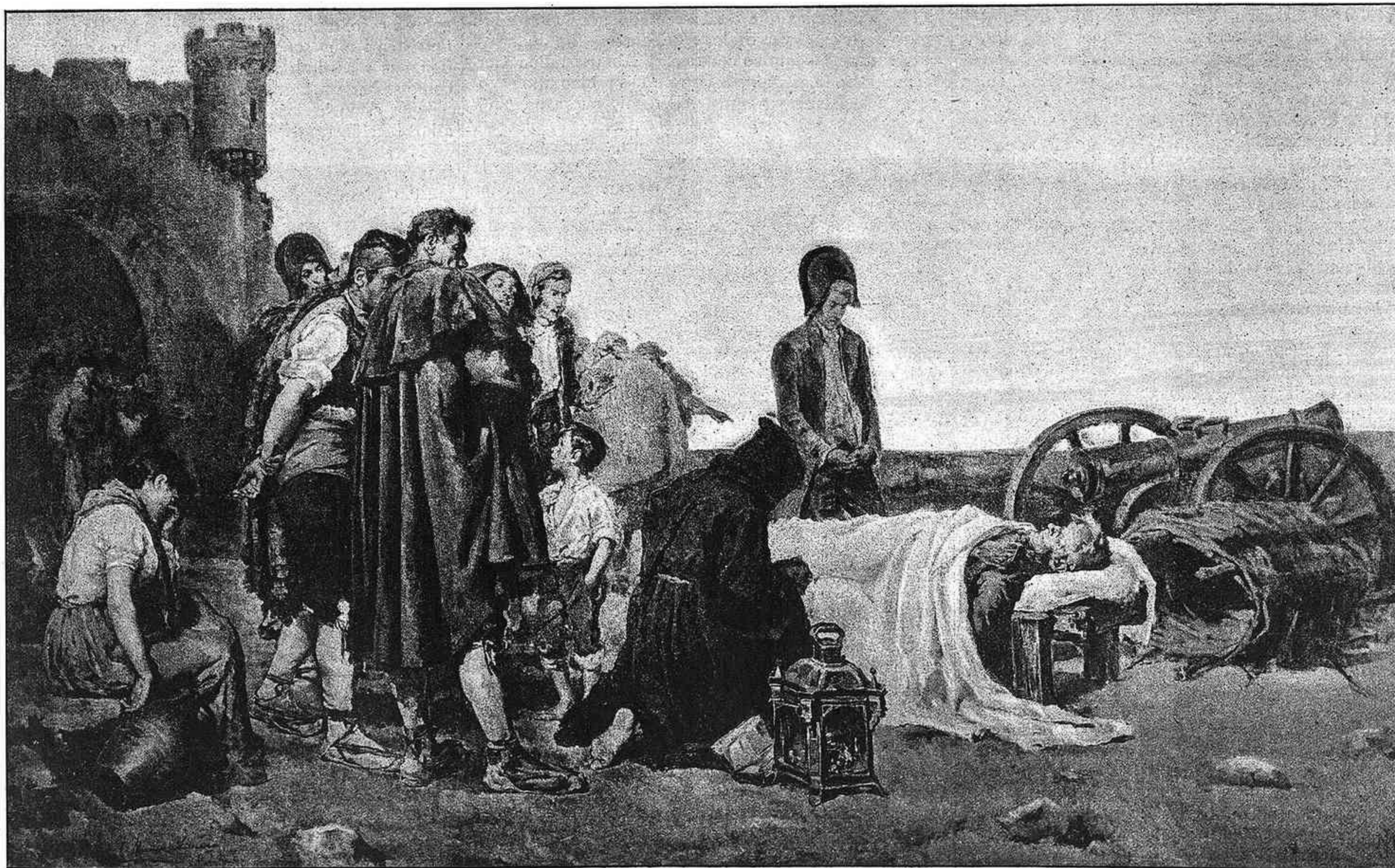
EL CADÁVER DE ALVAREZ DE CASTRO CUADRO DE T. MUÑOZ LUCENA. — (MEDALLA DE SEGUNDA CLASE).