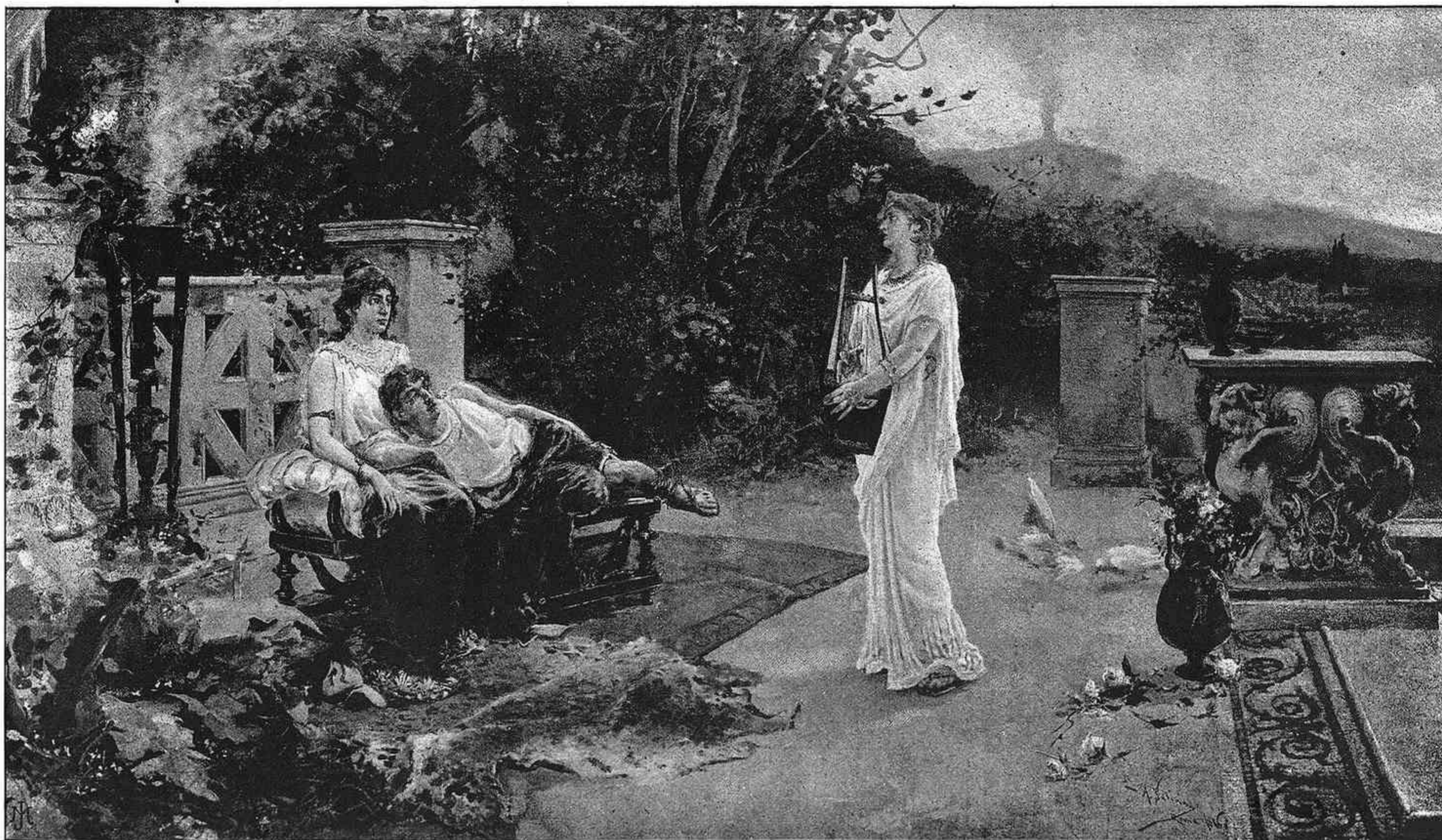
LA CANCIÓN DE TESALIA, cuadro de Agustín Salinas (certificado de mérito)

Los que no podían decir otra cosa, atacaban á Susillo diciendo que no servía más que para hacer pequeño; los que más prudentes reservaban su juicio, limitábanse á decir: es menester esperar á que haga algo grande. En la Exposición de Madrid luce su grupo, La primera contienda que es bastante para confirmar las esperanzas que en él se tenían. La elección de asunto no ha podido ser más feliz: vistas aquellas figuras agrupadas con tantísimo arte y gusto, no cabe dudar de lo que se trata: el amor maternal se refleja en el rostro de aquella matrona, que con verdadero embeleso contempla los rapazuelos que en su regazo se disputan por el pecho, por sus caricias ó por los celos que sienten. En cuanto á la ejecución no puede ser más feliz: el realismo de la forma no podrá llevarse nunca á la escultura, sopena de realizar una obra artística rechazada siempre por el arte. En este terreno puede establecerse una capital diferencia entre la pintura y la escultura: la primera puede representarlo todo, lo mismo grandezas que miserias: la segunda no puede ser intérprete más que de grandezas; las formas mezquinas y raquíticas, las desgracias naturales, las miserias de la vida,