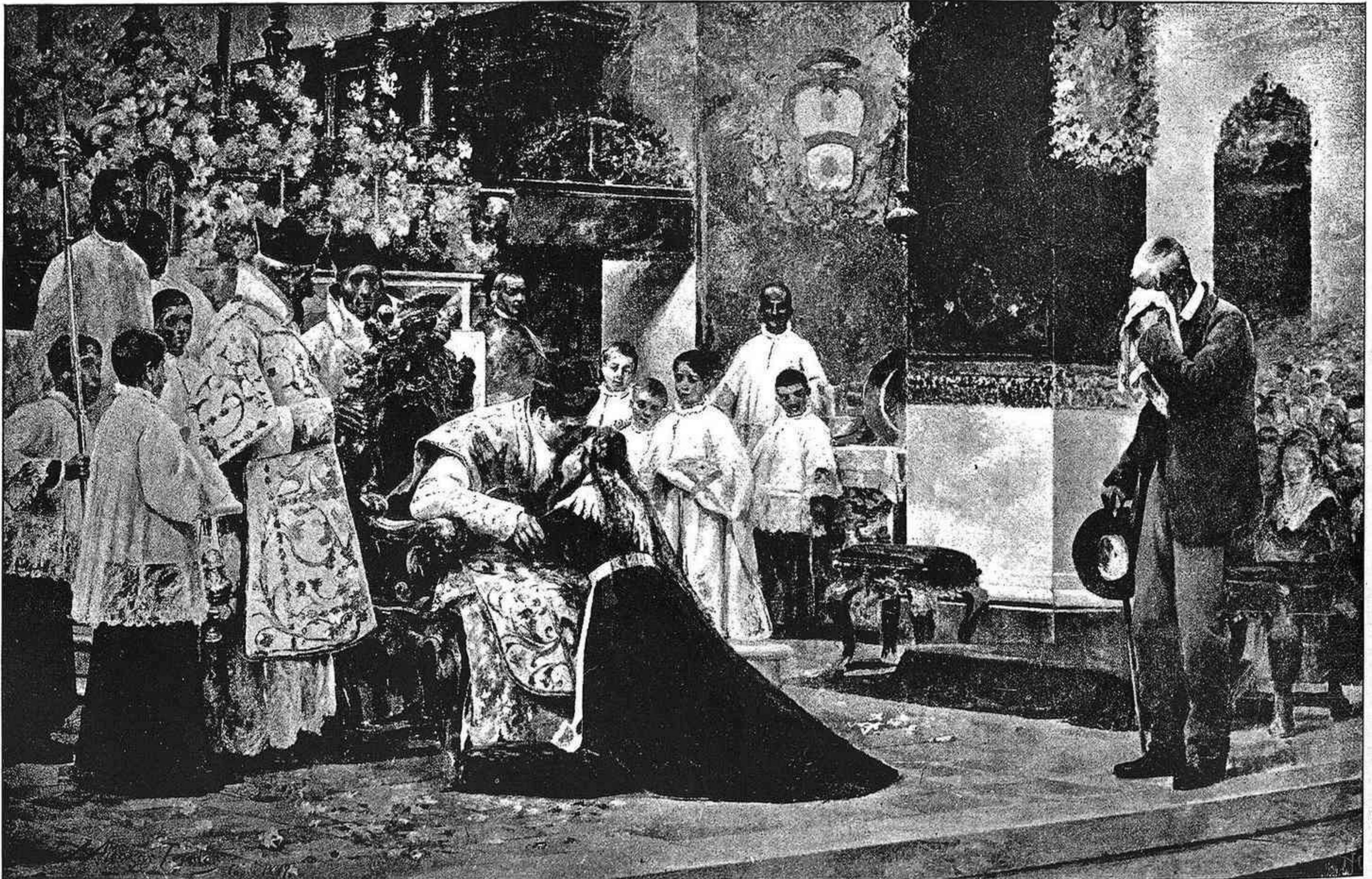
LOS PADRES DEL CELEBRANTE DESPUÉS DE LA MISA NUEVA CUADRO DE J. ALCÁZAR TEJEDOR. — MEDALLA DE SEGUNDA CLASE. — (De fotografía de Laurent.)