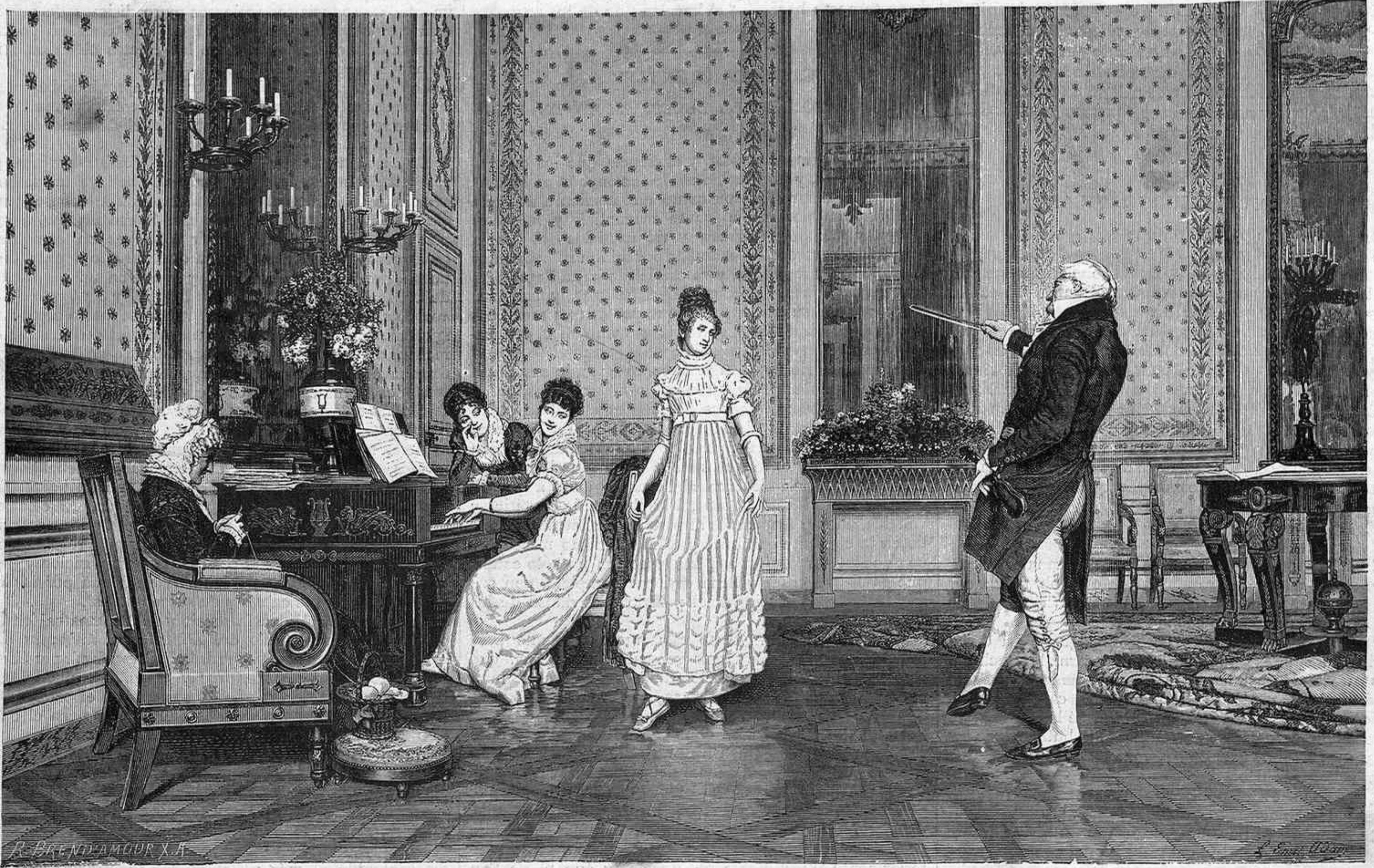
LA LECCION DE BAILE, por Emilio L. Adam

y no es maravilla ni la acción de los imanes sobre los imanes, ni la de las corrientes sobre las agujas magnéticas, ni la de las barras imantadas sobre los conductores eléctricos, porque estos tres órdenes de fenómenos reducen a uno solo: atracciones y repulsiones de las corrientes. El iman, la aguja magnética, las masas metálicas imantadas, son nombres distintos de una misma cosa: un sistema ó multiplicidad de circuitos por donde marcha el éter.