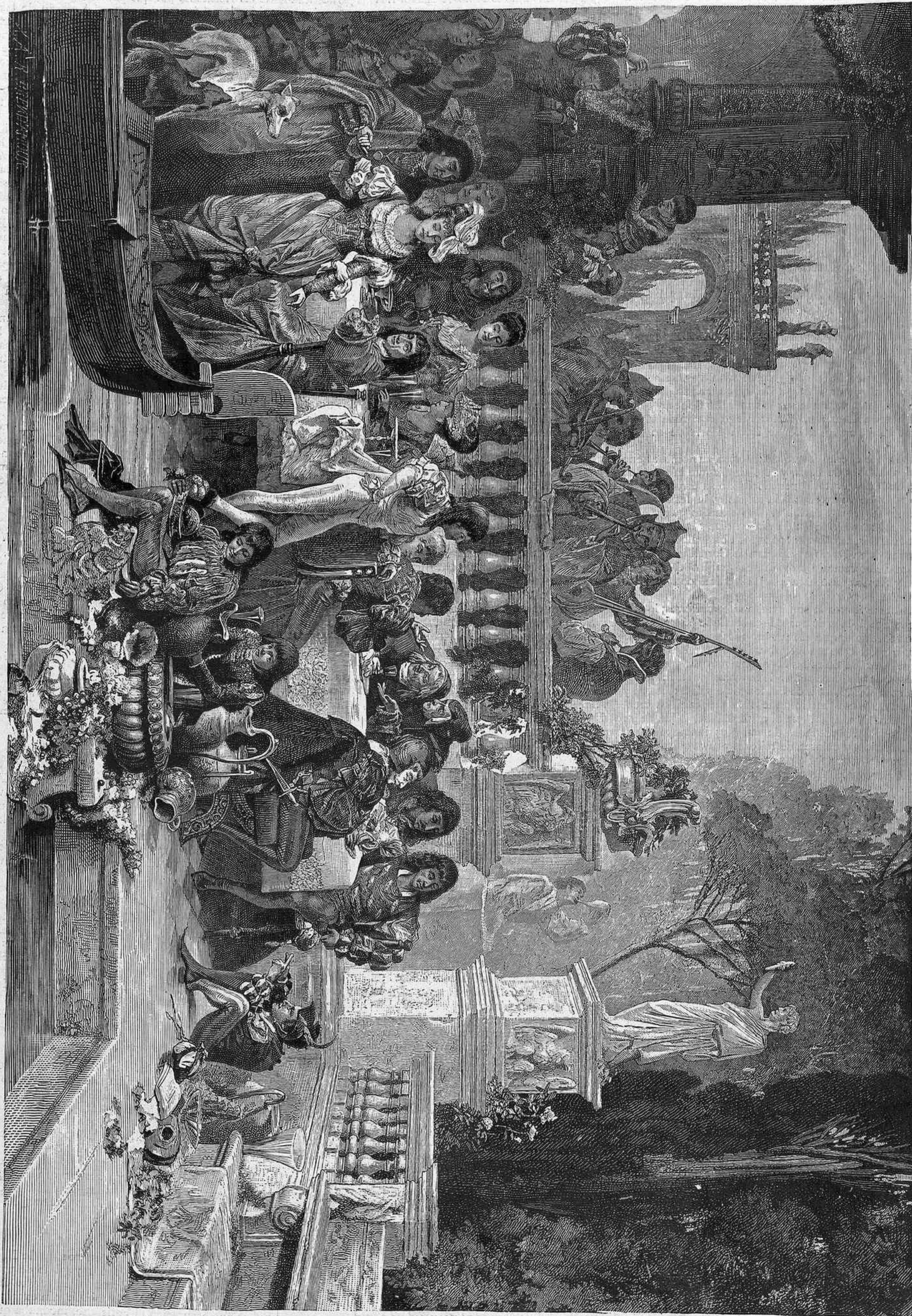
UN BANQUETE EN VENECIA, por H. Schneider