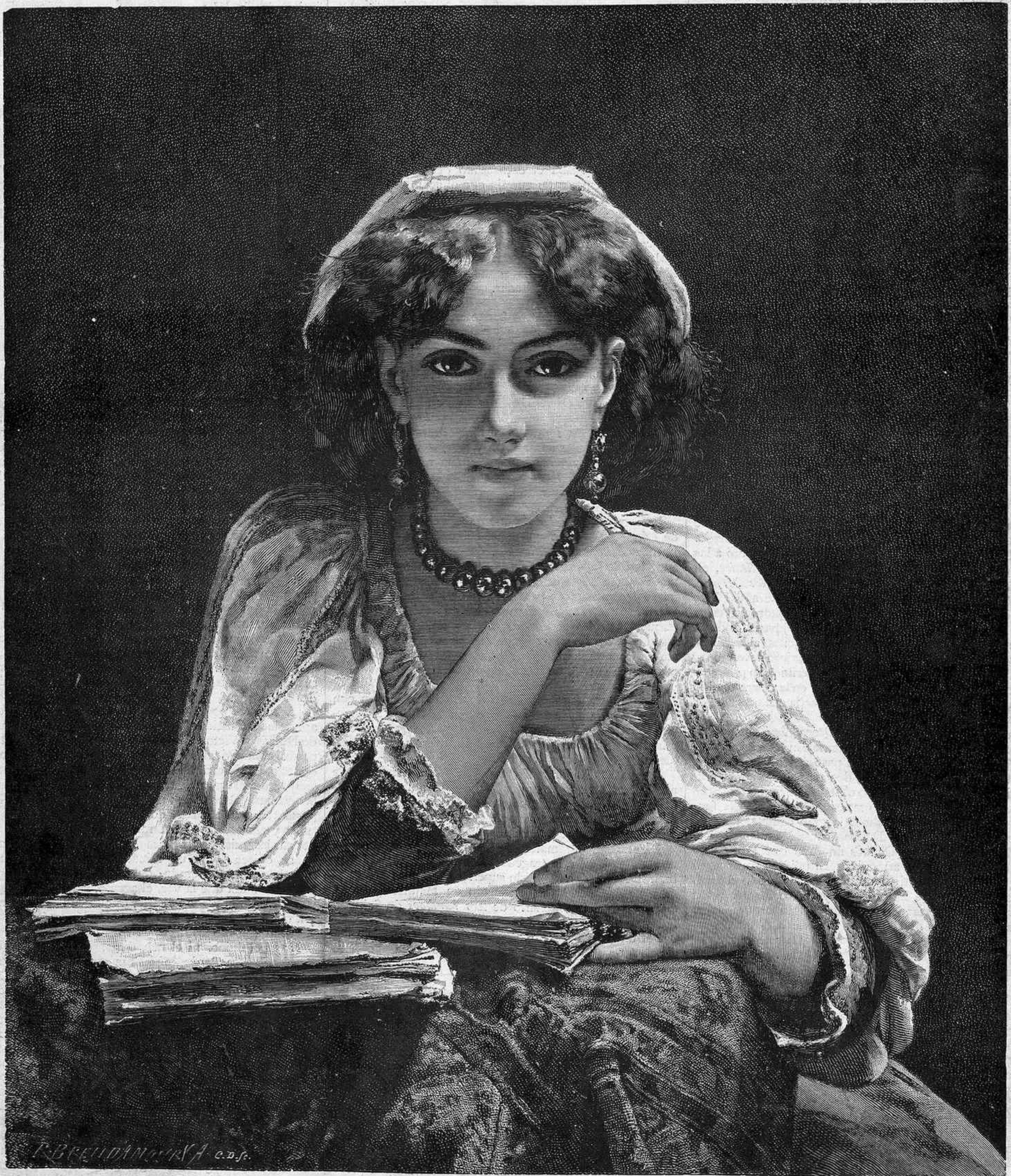
MUCHACHA ITALIANA, por Adolfo Piot

REGALO A LOS SEÑORES SUSCRITORES DE LA BIBLIOTECA UNIVERSAL ILUSTRADA