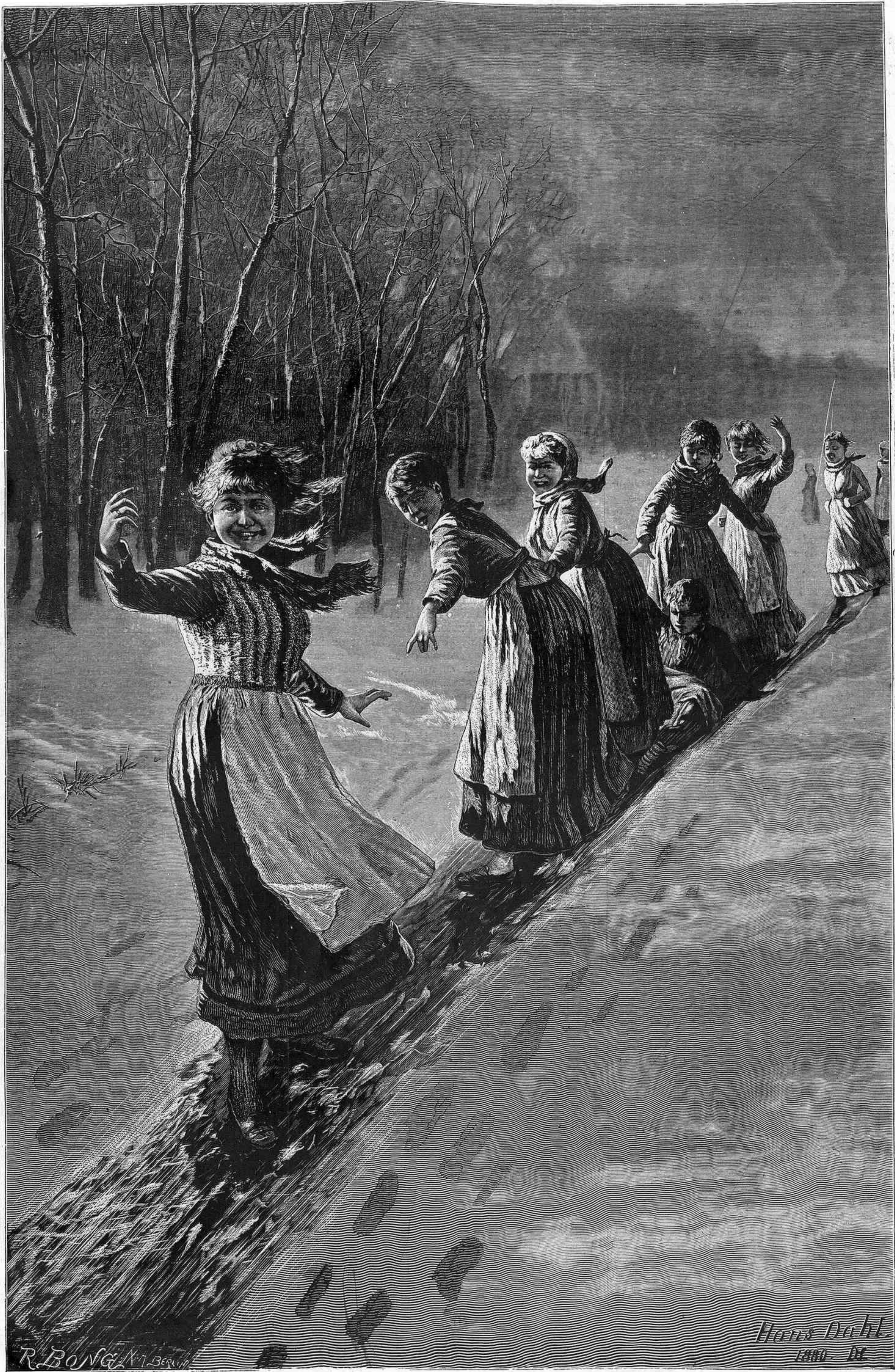
UNA SENDA EN EL HIELO, por Hans Dahl