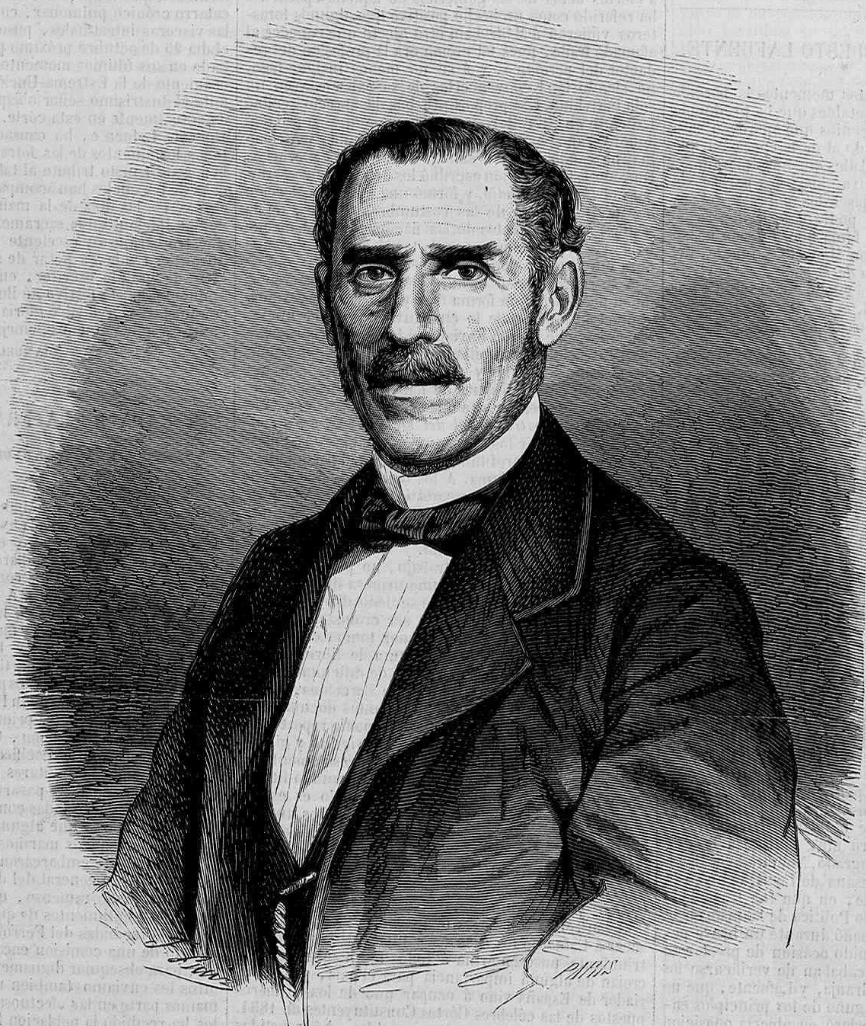
EL EXCMO. SEÑOR DON MODESTO LAFUENTE.

Filósofo, porque en sus escursiones por la miseria siente el frío de la tumba y mira alguna vez á las estre-