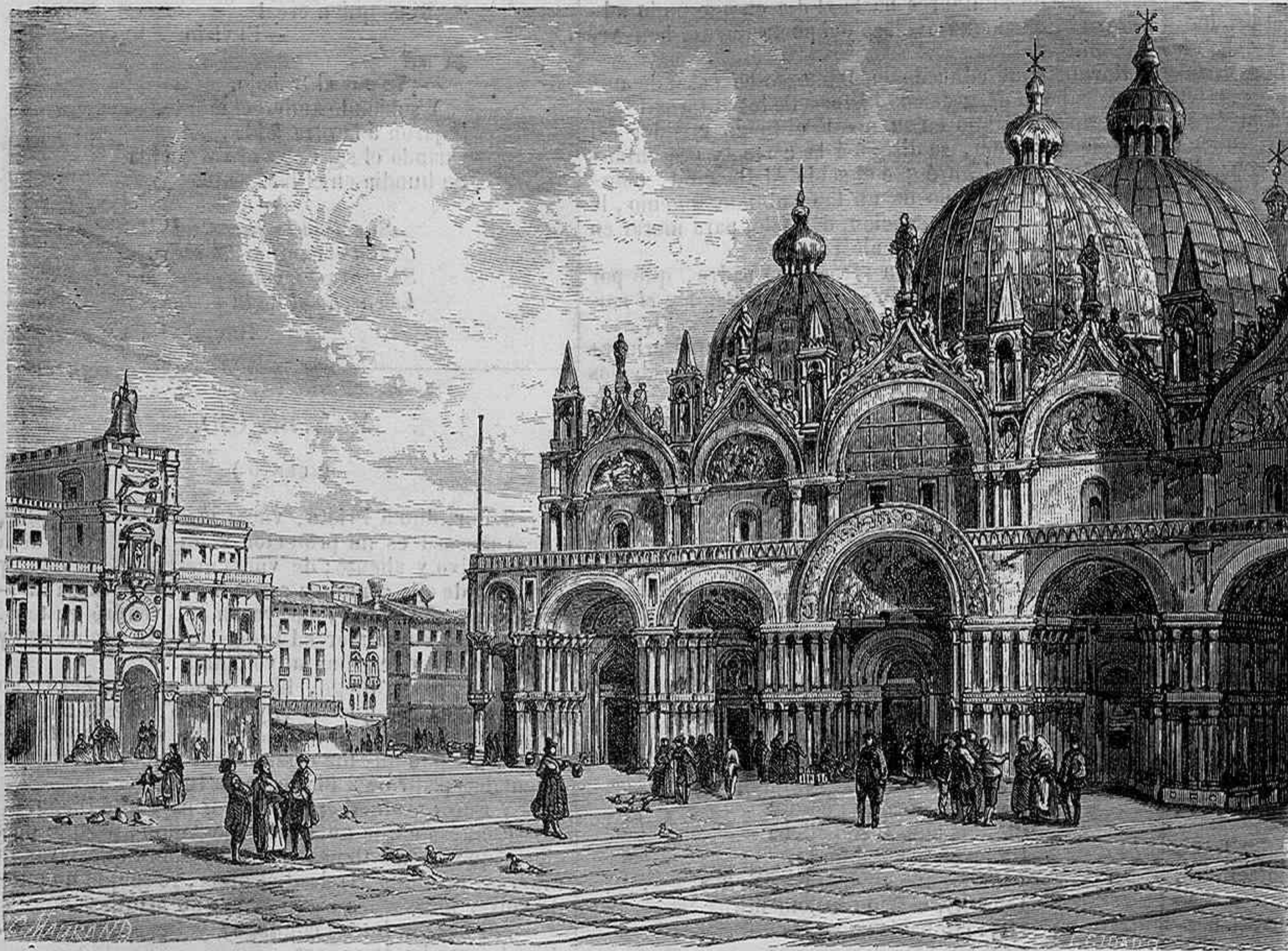
VENECIA.—PLAZA É IGLESIA DE SAN MARCOS.

pañerica, como podrá ver mas adelante el curioso lector, si en seguirlo siendo tuviese gusto.