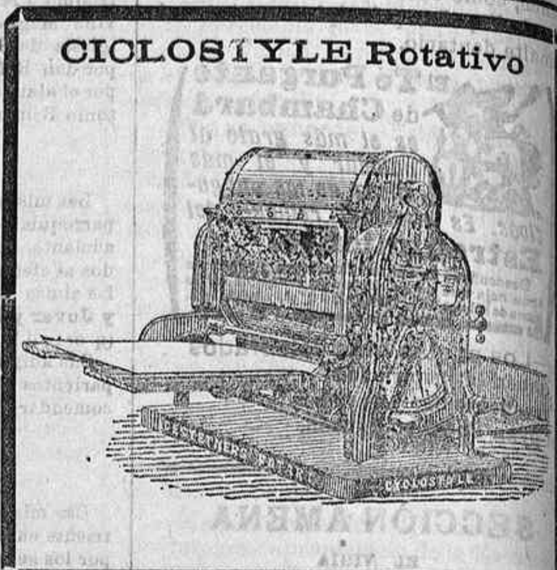
CICLOS Y LE Rotativo

P. S. A persona de responsabilidad y bien relacionada se le daría la representación en esta capital