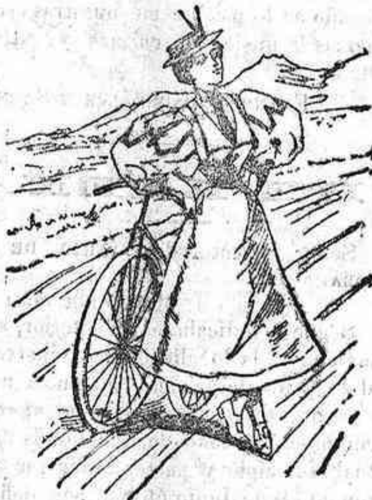
Traje para ciclista.

Modelos exclusivos para nuestras lectoras, de los grandes almacenes de «El Siglo», Barcelona. (1)