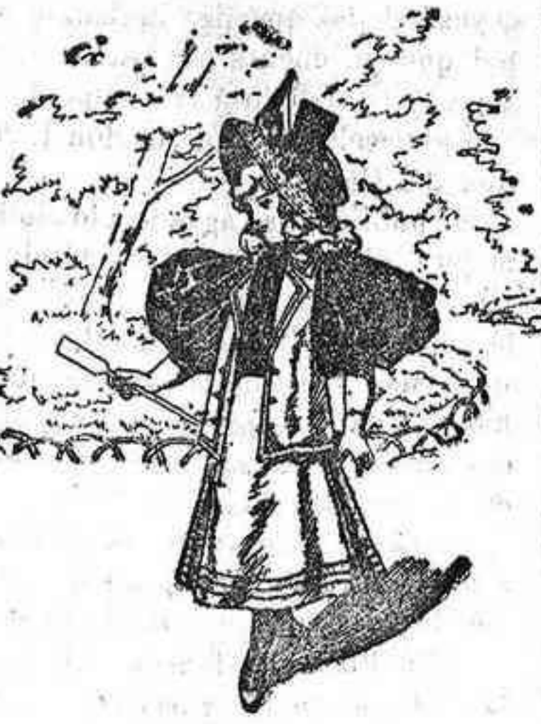
Traje para niña de 8 años.

De lana, color liso; cuerpo forma blusa; fruncidos en el talle, los que van recogidos por un cinturón de seda escocés; delantero liso, con tiras enlazadas en el centro y abrochado con botones de acero; cuello alto, igual al cinturón; mangas de una pieza, con unos pespuntos en el centro, tiras iguales á las del centro, en los hombros; falda forma campana, con pespuntos en el bajo.