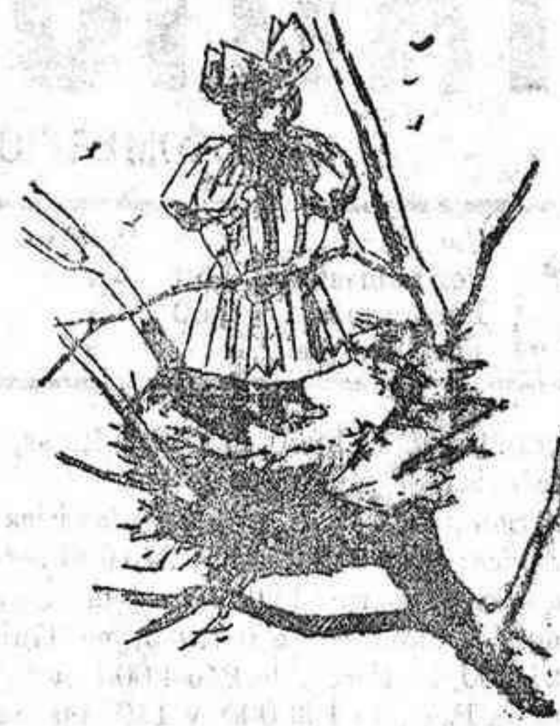
Traje para niña de tres años.

género que ésta; falda acampanada, con tres pespuntos en el bajo.