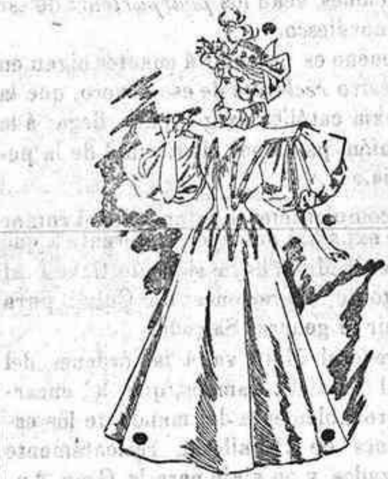
Traje para carreras.

CONFRECCIONES algo raras, es verdad, pero también en extremo caprichosas, son las que hoy tenemos el gusto de presentar á nuestras amables lectoras, por lo que creemos serán de su gusto.