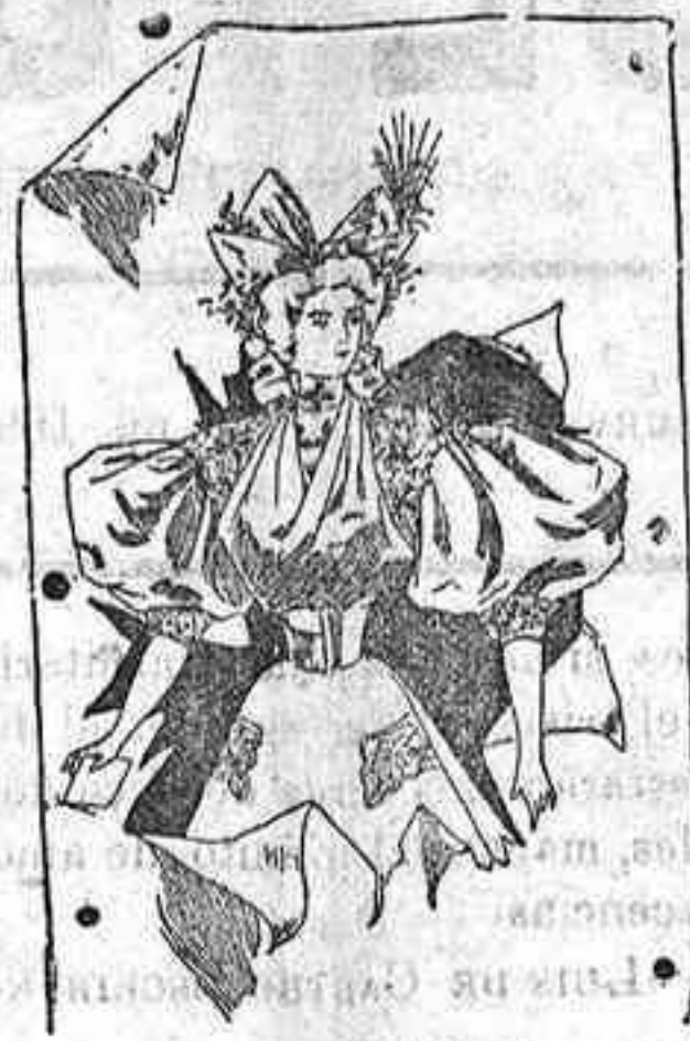
Traje para teatro.

formando picos en el delantero y alrededor de éste, como igualmente del talle, un galón de pasamanería color novedad. Cuello de cinta raso n.º 22.