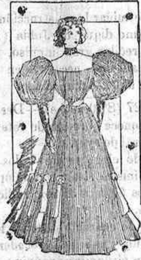
Traje para reunión.

De crepón de lana combinado con encaje guipur; delantero flojo partiendo desde los hombros, abierto en el centro y en cada lado de la manga y recogido en la cintura por un corpiño; cuello y piezas de encaje guipur; mangas cortas forma globo con un puño de lo mismo que el adorno. Falda forma capa con carteras de encaje igual al cuerpo.