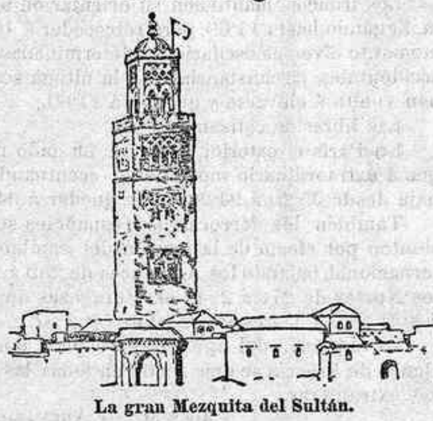
La gran Mezquita del Sultán.