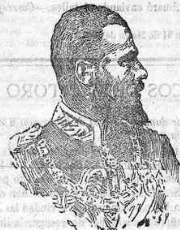
El Príncipe don Luis Fernando

El Príncipe don Luis Fernando de Baviera y su augusta esposa doña Paz de Borbón celebran sus bodas de plata, y en el regocijo natural por tan fausto suceso toman parte todas las clases sociales de Munich: la aristocracia, porque sólo atenciones y agasajos debe á los regios cónyuges, y las clases menesterosas porque hacia ellos sienten verdadera veneración. ¡Cómo olvidar que el Príncipe Luis Fernando es sapientísimo médico que sólo ejerce su profesión en beneficio de los pobres, y que su esposa vive pronta á enjugar lágrimas y á remediar necesidades.