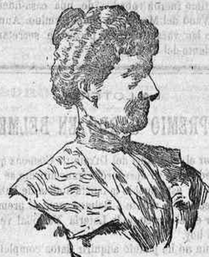
La Infanta doña Paz

Hoy, 2 de Abril, la capital de Baviera, la artística ciudad de Munich, viste de gala para tomar parte en una fiesta de carácter familiar, íntimo, á la cual la han invitado la gratitud y el afecto.