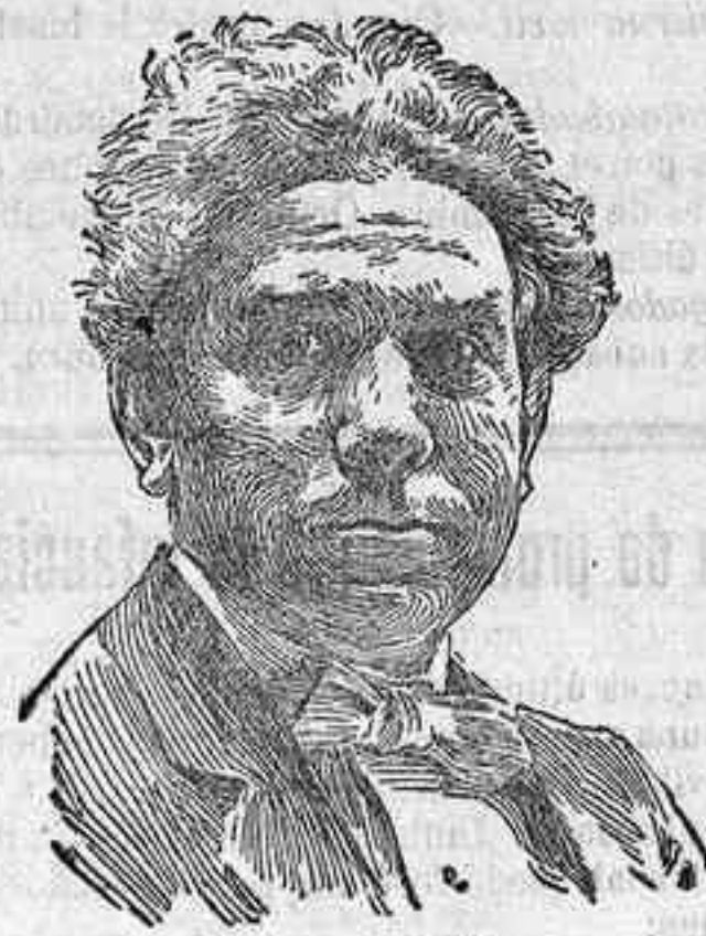
El maestro Vives

riaciones delicadísimas é inspiradas de minué y tarantela que terminan en una cadencia tan original como de buen efecto.