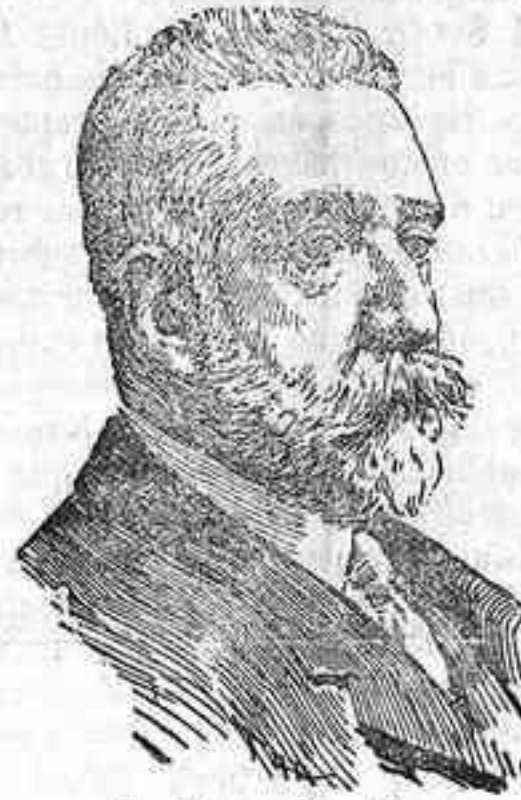
Sr. Ramos Carrión.

Siempre fué el insigne autor de La Marsellesa , de Los sobrinos del capitán Grant y de otras muchas producciones que en todos los tiempos se escucharan con gusto, maestro en el difícil arte de urdir una fábula interesante, hábilmente salpicada por un ingenio oportuno y fresco y cuyo desarrollo ofrecía al compositor repetidas ocasiones para poner á prueba su inspiración; y dada tal maestría, era de esperar que su última obra, Pepe Botellas , obtuviera el éxito franco que ha obtenido la noche de su estreno en el teatro de la Zarzuela.