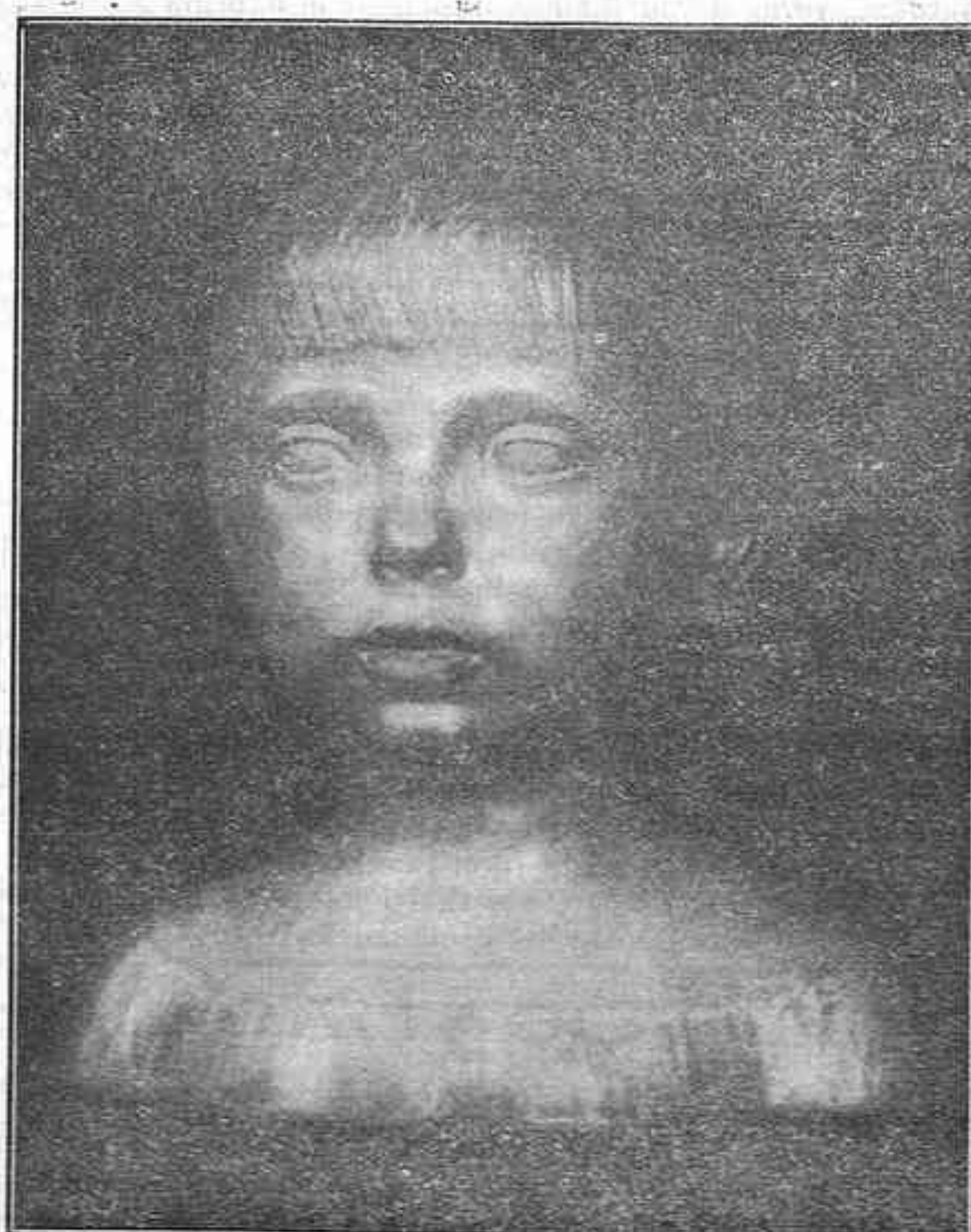
Cabeza de niño