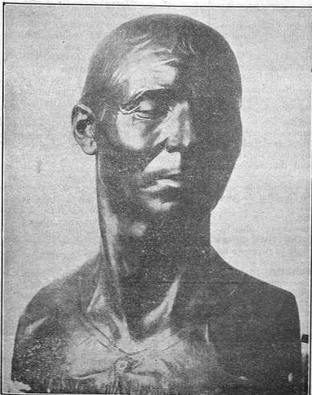
El hombre de la Mancha