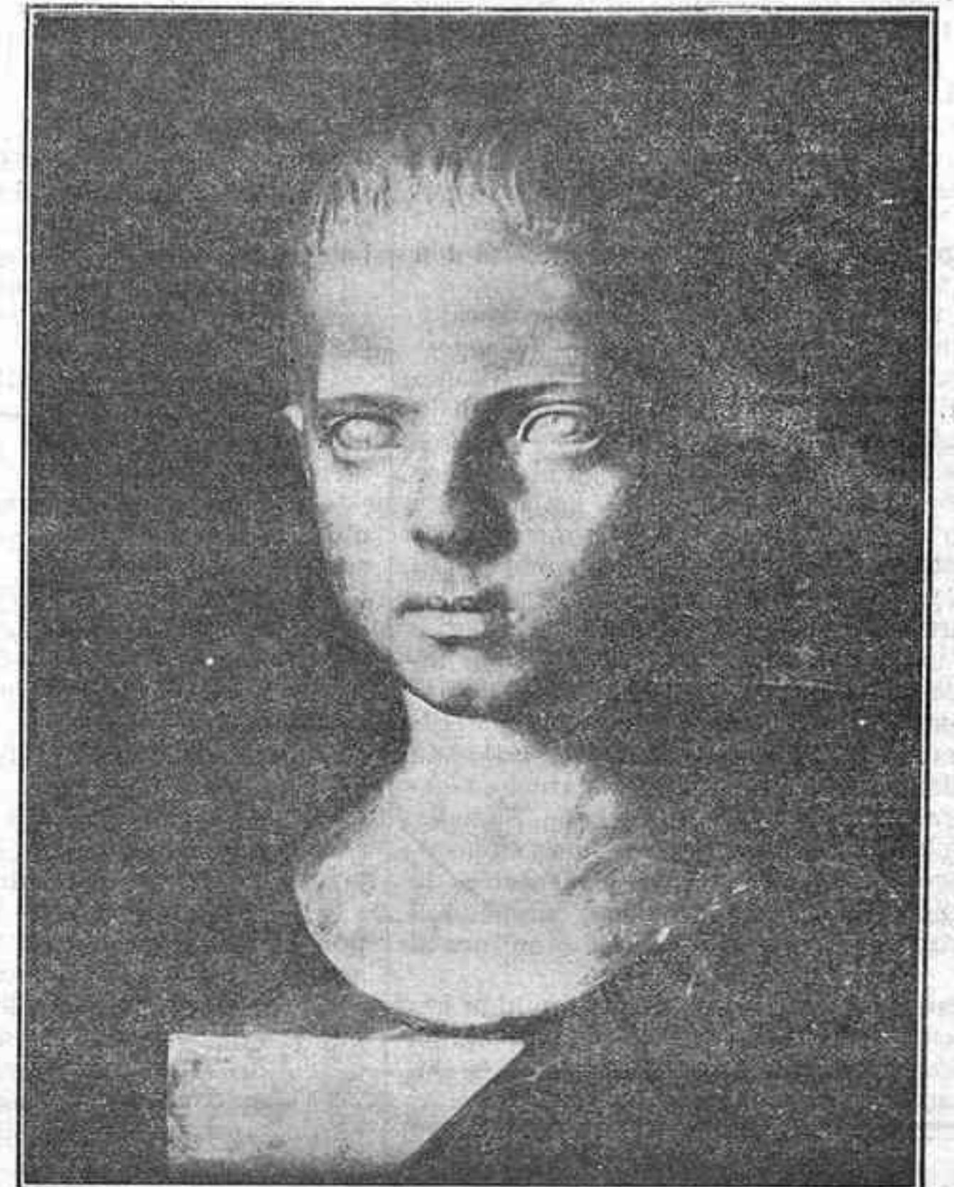
Cabeza de niño