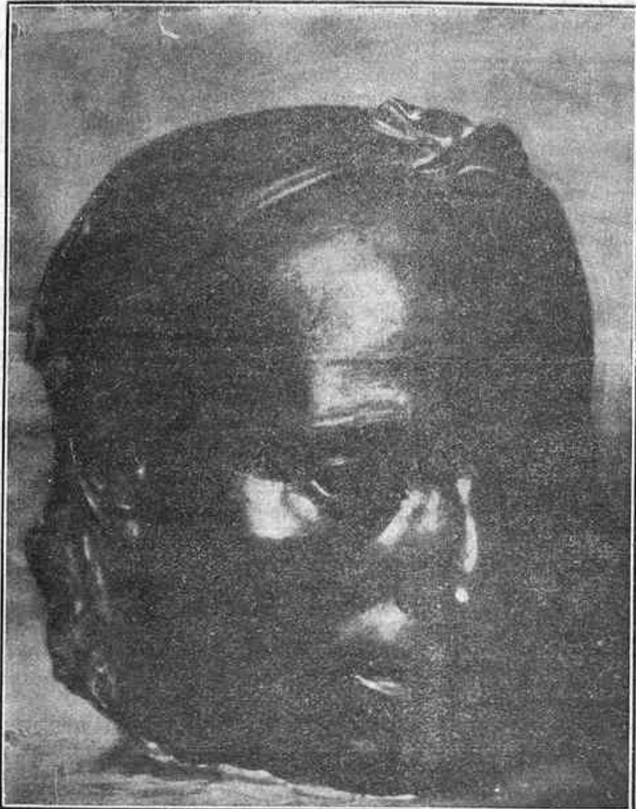
Cabeza de vieja