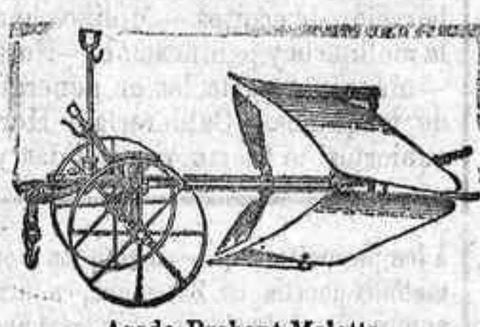
Arado Brabant Melotte

ARADOS Brabant MELOTTE y RUD-SACK. CULTIVADORES Planet.—GRADAS de muelle. SEBRADORAS "San Bernardo", con cajón. DISTRIBUIDORA de abonos.—TRITURADORES de Grano— Abono y CORTA-FORRAJES.