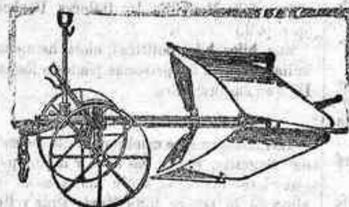
Arado Brabant Melotte

SEGADORAS Deering Ideal —HILO DE ABACÁ y CÁÑAMO para toda clase de atadoras.