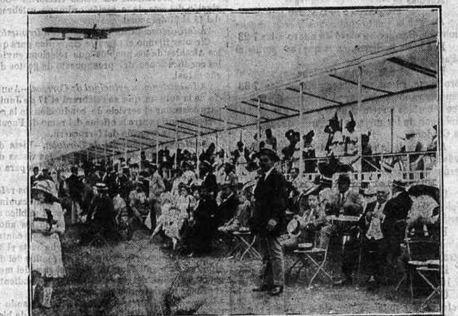
EL AVISOR GARNIER PASANDO AYER SOBRE LAS TRIBUNAS EN EL RECORRIDO DE TURRUÑUELOS