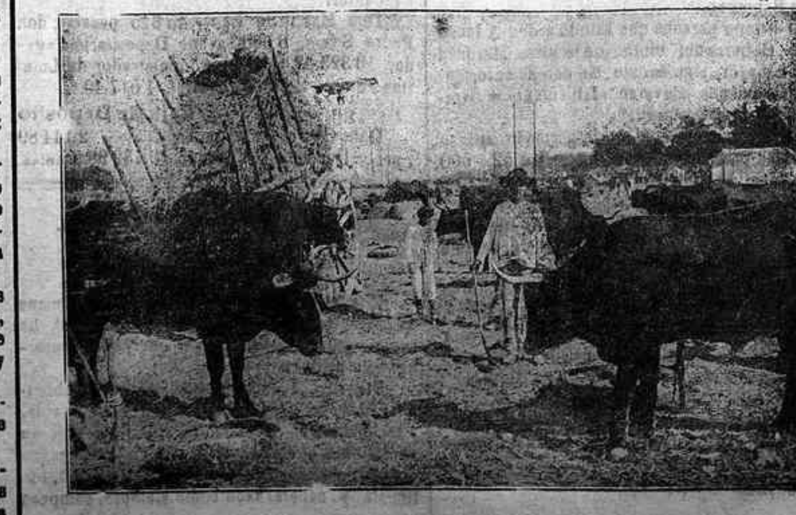
El mercado de ganados E. Díaz.

Había quince obstáculos y se matricularon veinte caballos.