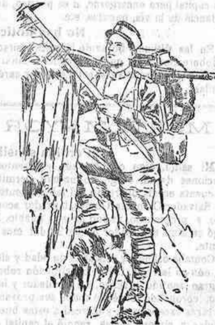
Un sargento de cazadores alpinos de Suiza

Con no muchas más razones que tenemos nosotros para seguir su ejemplo, Italia, Suiza, Francia, Austria y Alemania poseen un núcleo de tropas perfectamente adiestradas en el alpinismo, y que generalmente se las llama «cazadores alpinos.»