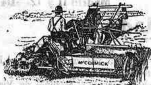
Alfadoras Macormick — ULTIMA PERFECCION —