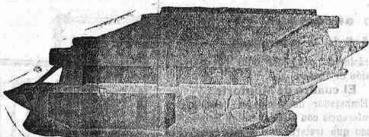
TRILLO ROTATIVO DE GRAN TRABAJO para una sola yunta de mulos,