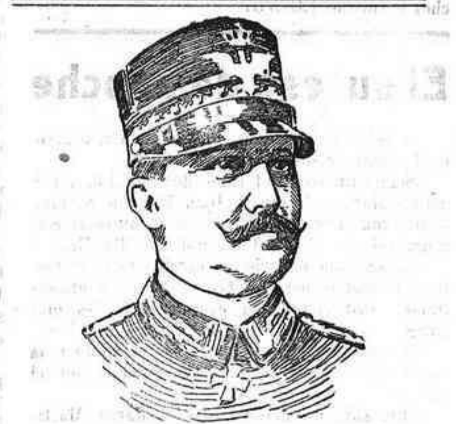
Figuras de la guerra.—El general Garioni, que manda uno de los cuerpos de ejército italianos que operan en la región del Isonzo.

Cambios sobre el extranjero.—París a la vista, 89'90.—Londres a la vista, 24'85