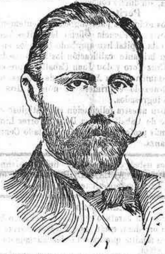
Señor Krivocheine nuevo presidente del Consejo de ministros de Rusia.