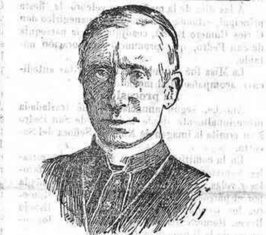
El cardenal norteamericano Gibbons que ha rea- lizado importantes trabajos en favor del restable- cimiento de la paz.

La defensa y representación del procesado es- tán encomendadas a los señores Trillo y García Varo.