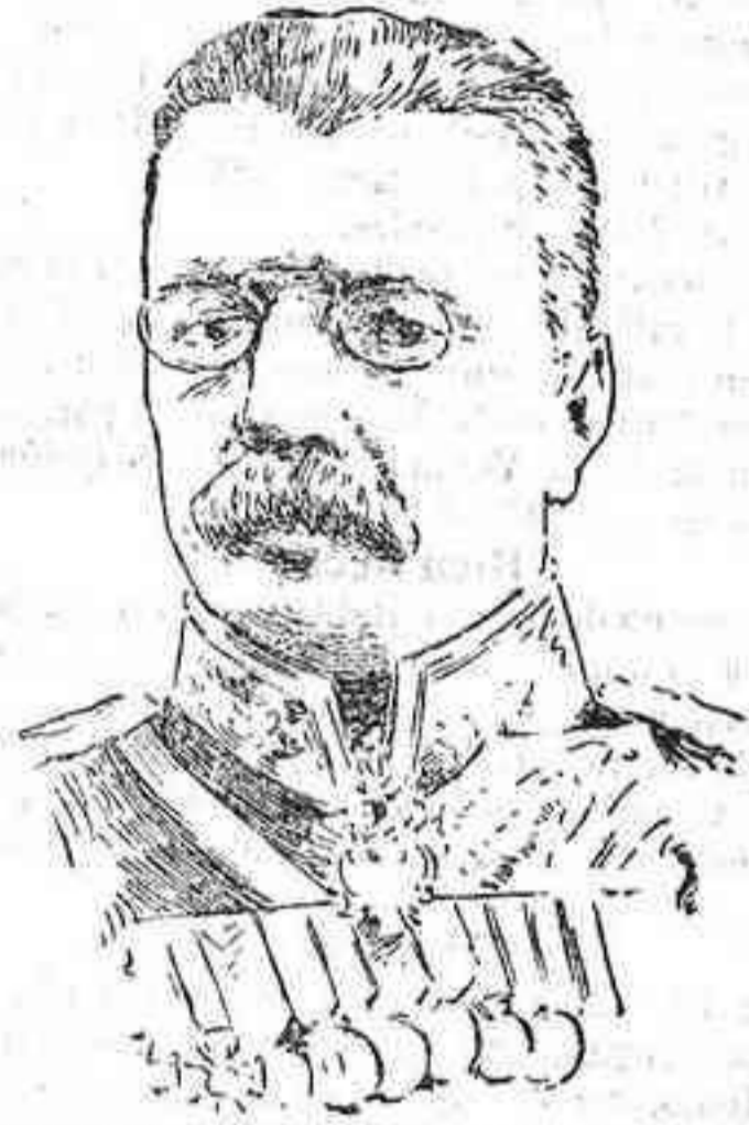
El general Rousski, a quien el zar Nicolás II ha nombrado su ayudante y jefe del Estado Mayor en virtud de lo cual es jefe efectivo de los ejércitos rusos.

Con el objeto de satisfacer la creciente demanda de ejemplares del DIARIO y para mayor comodidad del público, los números sobrantes de la tirada corriente quedan puestos a la venta en los kioscos de las Tendillas, la calle del Conde de Gondomar y la Estación, dejándose de expendernos en la Administración de este periódico.