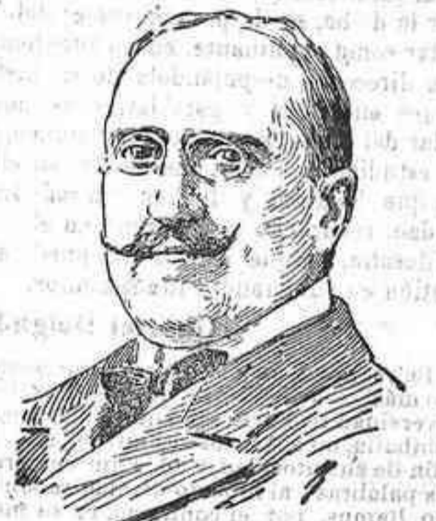
Don José del Prado y Palacio, nuevo alcalde de Madrid.