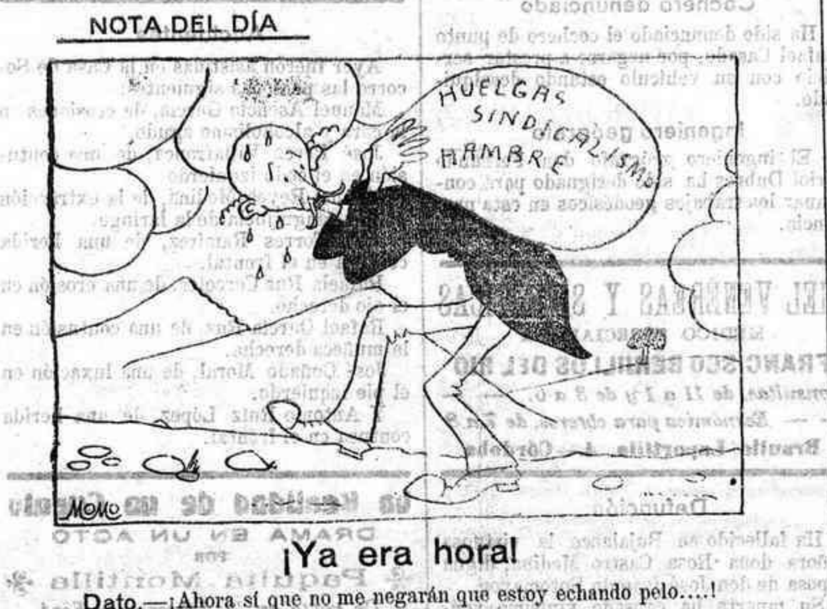
Nota del día: Ya era hora. Dato.—Ahora sí que no me negarán que estoy echando pelo...

individuales empeños, transmitidos a las asociaciones que los propaguen formando estado general de opinión, conciencia colectiva!