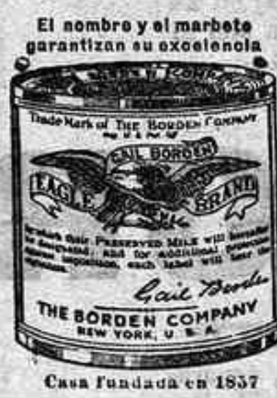
El sello y el marbete garantizan su exactitud. Casa Fundada en 1837