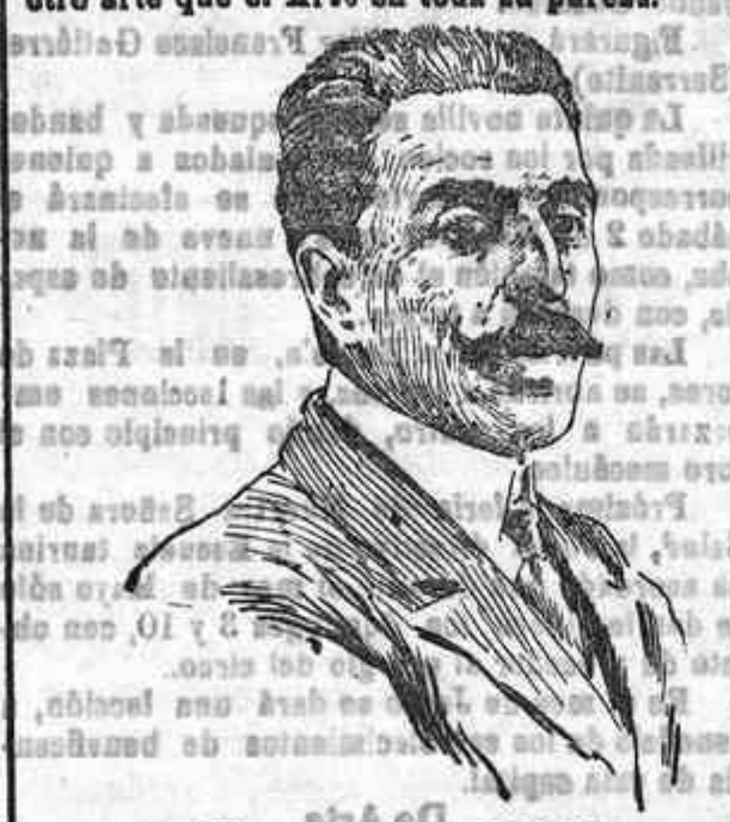
El maestro Saco del Valle

El nombramiento del señor Saco del Valle para la cátedra de Contralto, ha producido el mejor efecto, y como se, aparte de las razones de su merecimiento, si en todas partes se tiene un muy grande estima, por su genio musical y por su cultura artística, al eminente compositor? Su labor como director de orquesta del Teatro Real, demuestra que es un solerte su nombramiento de profesor de Contralto. En España y en el extranjero, Saco del Valle ha cosechado abundantes y merecidos laureles dirigiendo óperas y conciertos. Lo mismo entre los jóvenes que entre los jóvenes, difícilmente se hubiera encontrado un músico con tantos merecimientos para el difícil puesto que va a desempeñar.