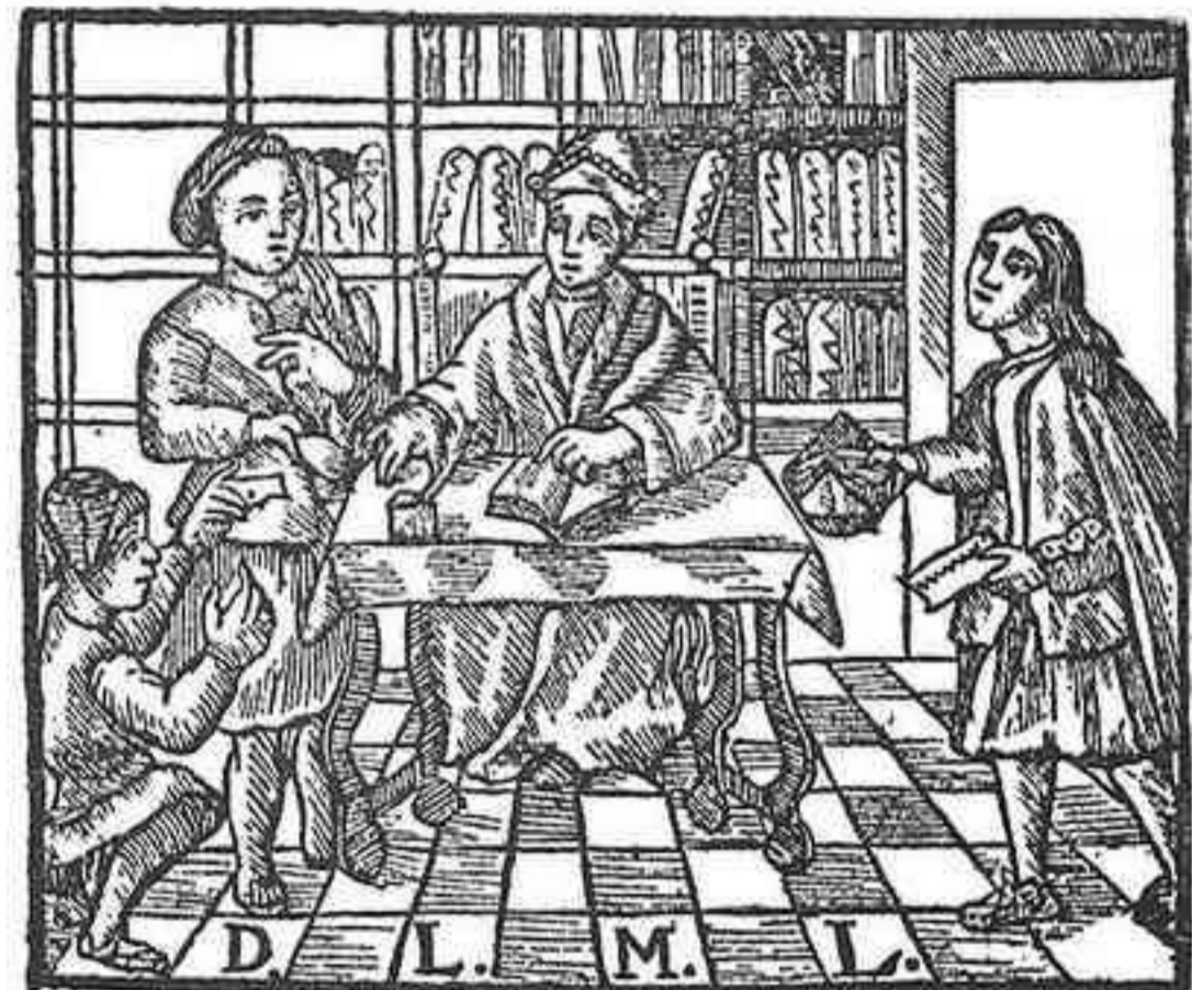
D'un col·loqui de Ros sobre l'art de notaria