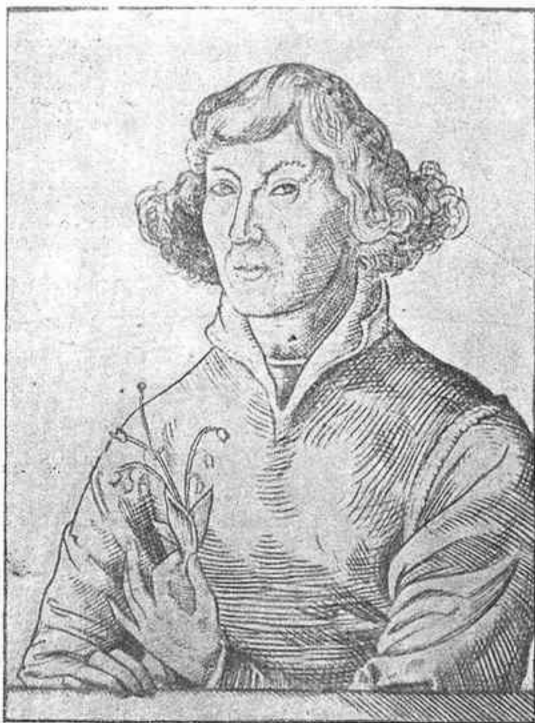
Copèrnic (gravat alemany anònim)

Es cert que Kant, com Copèrnic, feia una revolució i per cert molt més transcendental.